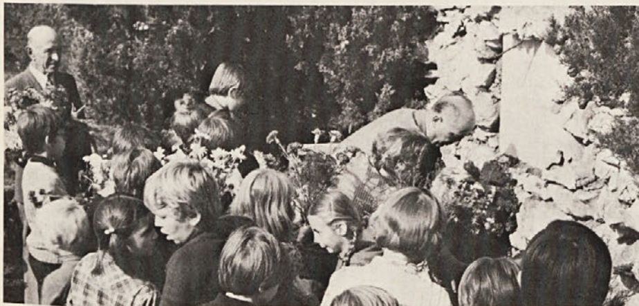
Učenci openskih šol polagajo šopke cvetja pred spomenik pri openskem strelišču