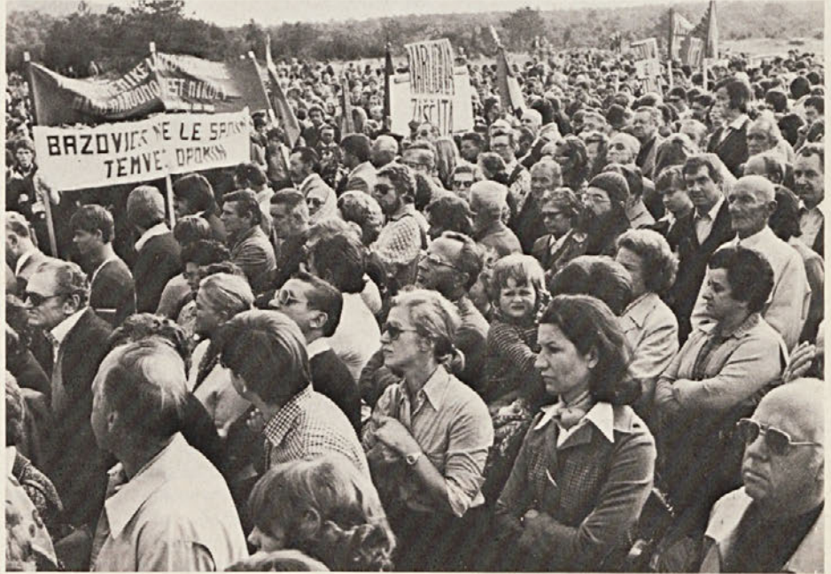
Protestna manifestacija ob oskrnjenem spomeniku na bazovski planoti

Vse to nas vendar na nekaj opozarja: narekuje vsem iskrenim demokratom, protifašistom, da okrepimo budnost in tudi aktivnost!