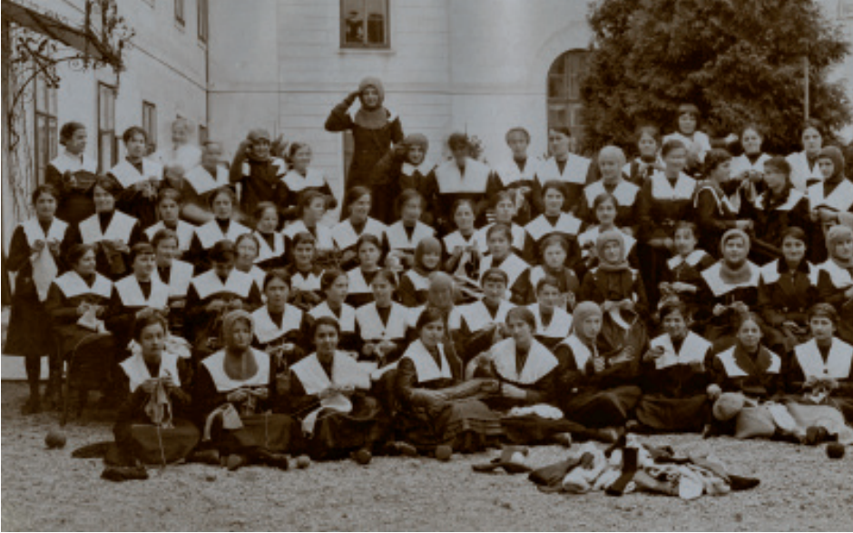
Dekleta in žene so vsa vojna leta pletla volnene obleke in druge izdelke za vojake. Na fotografiji so gojenke uršulinske šole v Škofji Loki, ki pletejo za vojake. Fotografija je nastala leta 1915.