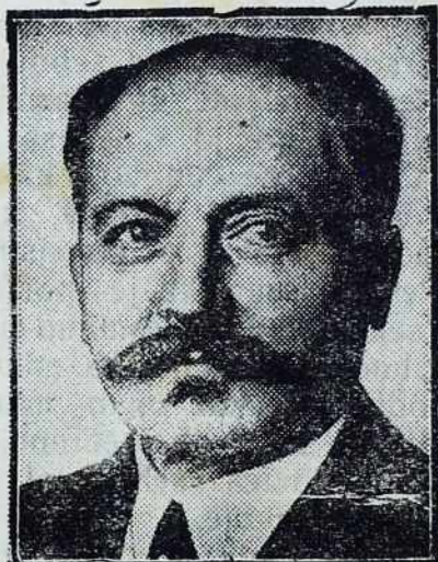
Lebrun Albert , na novo zvoljeni predsednik francoske republike.