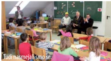
Tudi nasmejali smo se.

V petek, 20. novembra, sredi dopoldneva, smo se tudi zaradi te obljube znašli pred vrati vrt-