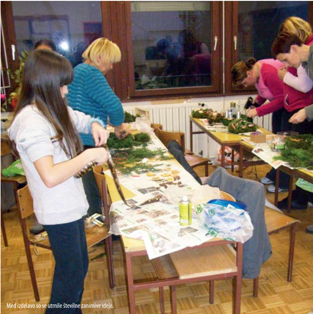
Med izdelavo so se utrnile številne zanimive ideje.