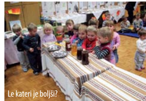
Le kateri je boljši?

Recimo, da bi enkrat mesečno dan preživeli skupaj, otroci, vzgojiteljice in čebelarji v naravi, obiskali čebelnjak, se pogovarjali o čebelah, čebelarjenju, rastlinah in čistem okolju. Z veseljem smo sprejeli to pobudo. Morda