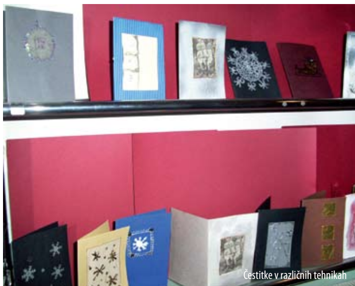
Čestitke v različnih tehnikah

Vabljeni k ogledu razstave in seveda tudi k obisku knjižnice, ki je že davno postala premajhna za vse knjige in ljubitelje branja.