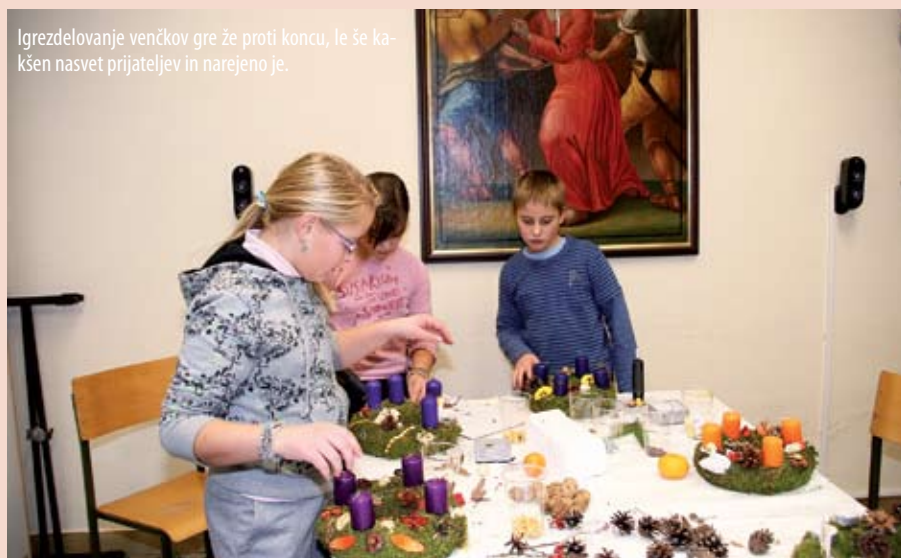
Igrezdelovanje venčkov gre že proti koncu, le še kakšen nasvet prijateljev in narejeno je.