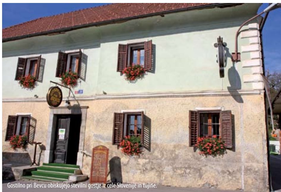
Gostilno pri Bevcu obiskujejo številni gostje iz cele Slovenije in tujine.