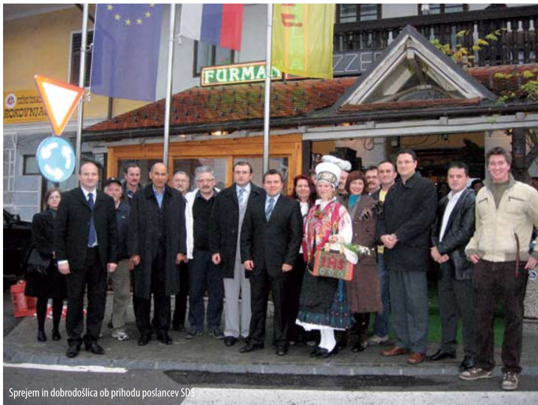
Sprejem in dobrodošlica ob prihodu poslancev SDS