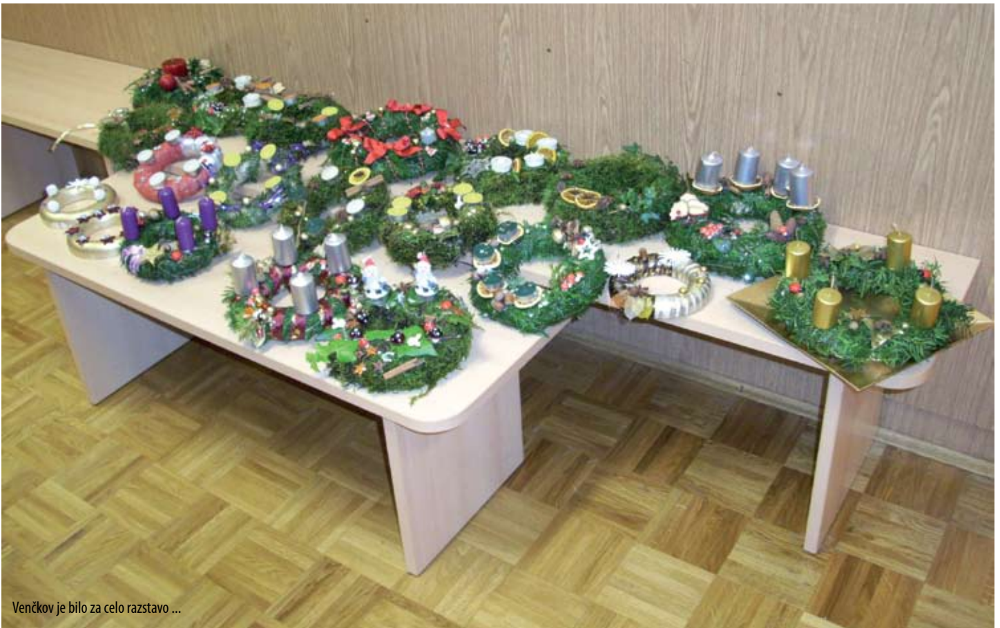
Venčkov je bilo za celo razstavo ...

V podružnični šoli v Krašnji so pripravili vse potrebno orodje in material, od obodov za venčke pa do okrasov iz pretežno naravnih materialov. Nekaj mahu, jelkinih vej in zelenja so s seboj prinesli tudi udeleženci. Odzvali so se predvsem šolarji in njihove mamice, pa tudi kakšen očka se je našel vmes. Med prijetnim ustvarjalnim druženjem so nastali številni različni in zanimivi adventni venčki. Ti bodo družine razveseljevali vsaj do božičnih praznikov in morda še dlje. Takšne delavnice so v manjših krajih še posebno dobrodošle, saj ob prijetnem opravilu združujejo krajanke.