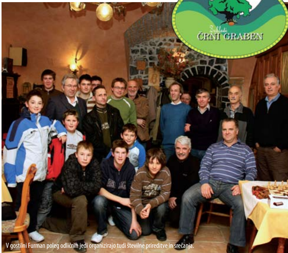
V gostilni Furman poleg odličnih jedi organizirajo tudi številne prireditve in srečanja.

Gostilna Furman je med tovrstnimi ponudniki najmlajša. Letos bo 15. decembra