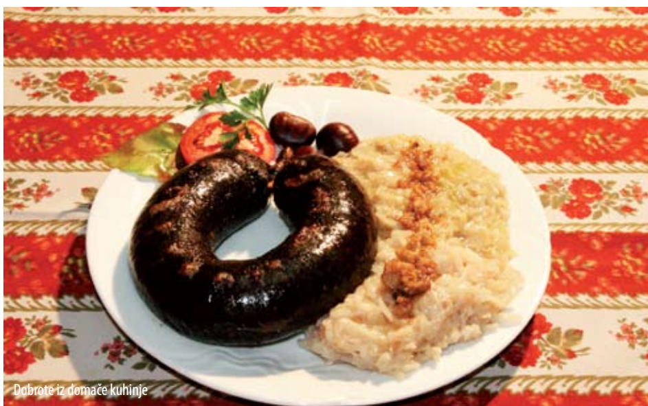
Dobrote iz domače kuhinje