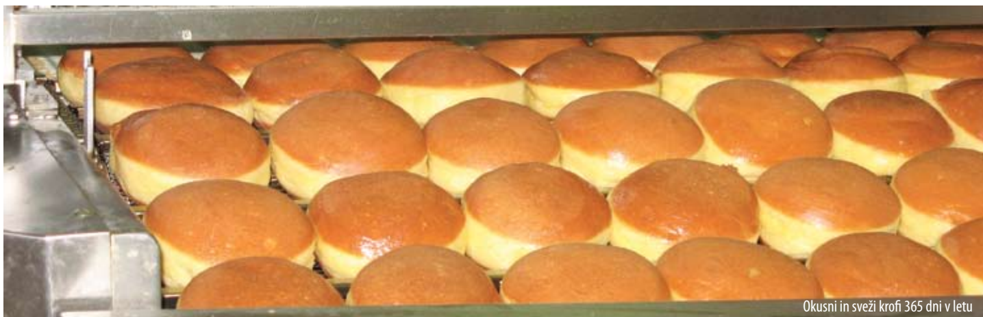
Okusni in sveži krofi 365 dni v letu

je skoraj 365 dni v letu. Znani po odlični in hitri postrežbi ter okusnih jedeh, s katerimi se ponajbolj že vrsto let. Njihova kakovost se je še najbolj izkazala na preizkušnji leta 2005, saj se je takrat odprla velika prometna žila. Kljub slabim, dvomljivim napovedim je podjetje s 109 zaposlenimi dokazalo, da ima pred seboj stabilno in zagotovljeno prihodnost, saj mu avtocesta ni bistveno zmanjšala prometa, je pa spremenila strukturo gostov. Že ko se pripelješ na dvorišče, postaneš omamljen od dišav iz slaščičarne in krofarne. Njihova posebnost je tudi trojanski hlebček, ki ga spečejo v pekarni za restavracijo in tega gostje z veseljem kupijo tudi v trgovinici. Čeprav sama nisem posebno navdušena nad slaščicami, me je že sam pogled nanje povsem prevzel.