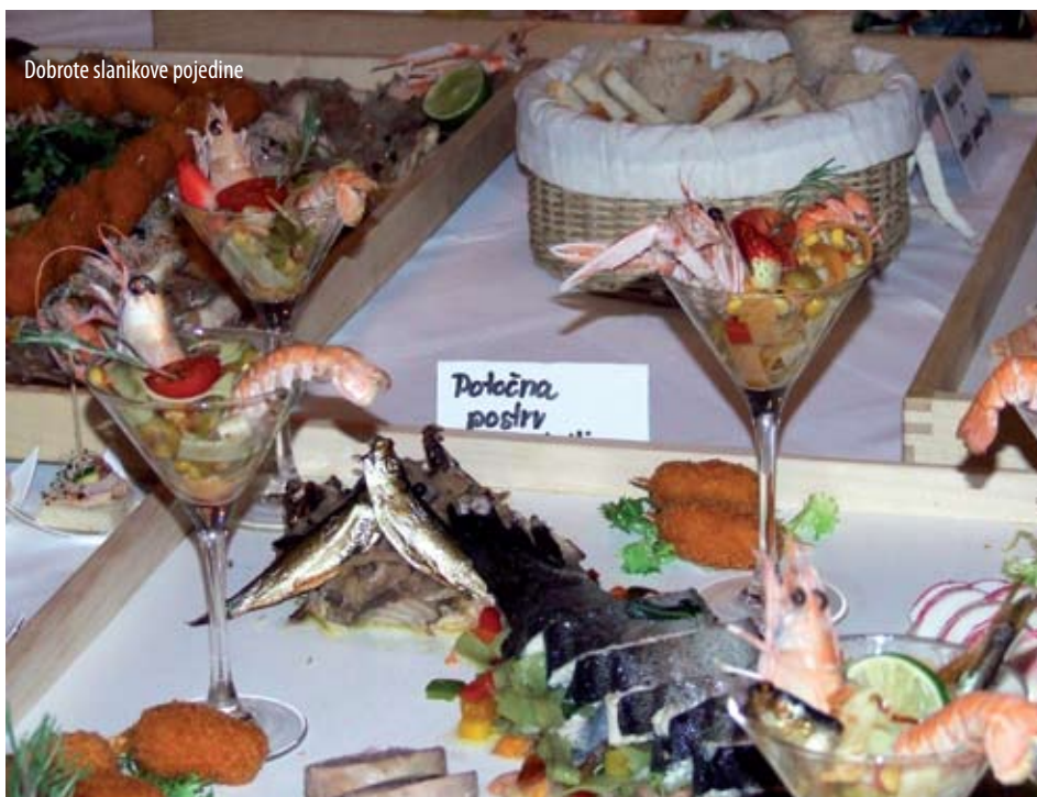
Dobrote slaničkove pojedine