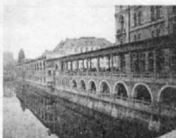
Tržnice za škofijo

Slovenski arhitekt, urbanist in oblikovalec, rojen v ljubljanskem predmestju Gradišče, se je šolal za mizarja na Obrtni šoli v Gradcu, da bi tako nadaljeval družinsko tradicijo. Po končani šoli