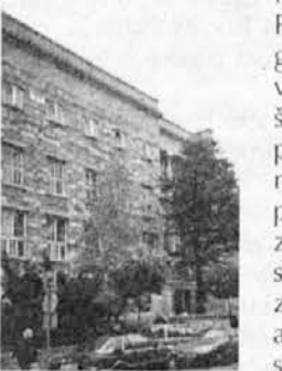
NUK v Ljubljani.

Plečnik se je vseskozi ukvarjal tudi s pohištvo, svetilkami, z liturgičnimi predmeti in grafičnim oblikovanjem. Predvsem so znani njegovi številni kelih, ki jih je snoval od leta 1913 dalje.