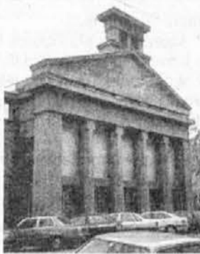
Cerkev Sv. Duha

Ko je zapuščal Prago, ga je češkoslovaški predsednik Masaryk imenoval za arhitekta njegovo prenovo. Plečnik se