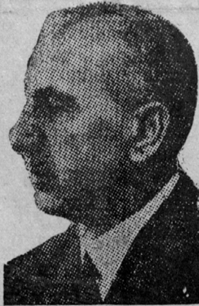
Dr. Momčilo Ninčić

"Pri vseh naših zaveznikih in prijateljih naletava držanje srbskega naroda na popolno razumevanje in iskrene simpatije. V Angliji, v Rusiji in pri vseh drugih narodih vedo, koliko smo storili za skupno stvar. Sočustvujejo z nami in cenijo naše požrtvovanje. Težke so preizkušnje, ki jih sedaj prestaja srbski narod. V svoji zgodovini je le malokdaj imel težje preizkušnje, toda bodočnost je naša. Mislimi je treba na boljše dneve, ki bodo prišli. Ohraniti moramo prisotnost duha in treznost presojanja. Kloniti ne smemo nikdar!"