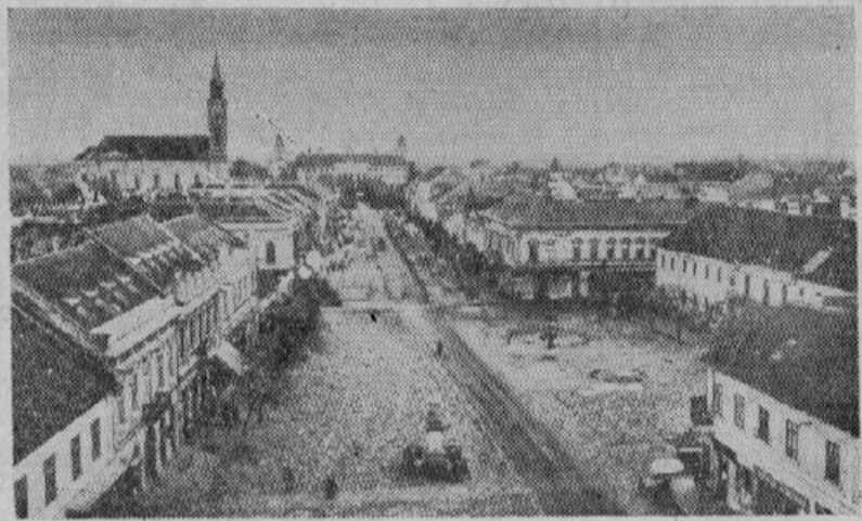
Posebno sodišče v Somboru deluje. Obsodilo je 18 'komunistov' na smrt.