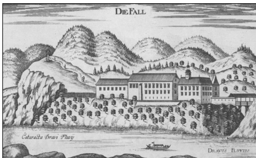
Georg Matthaeus Vischer: Fala, bakrorez ( Topographia Ducatus Stiriae, Gradec 1681 ).

sirnice. Ob tem so sirnice oddajale še pravdo (štiri, od 50 do 130 d (1502) oz. 60 do 130 d (1513, vse v denarju)) in nekaj drugih dajatev, največ (štiri) po sodček žita.