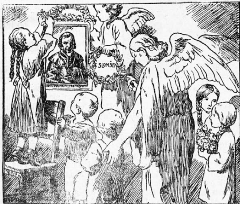
Sedemdesetletnica Slomškove smrti.

Na sliki vidimo otroke, kako krasijo podobo vélikega služabnika božjega mariborskega škofa Antona Martina Slomška za njegov slovesni praznik, ki bo 24. septembra. Angeli jim pri tem opravilu ljubeznivo pomagajo.