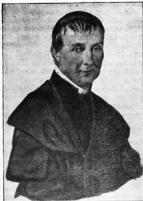
Slomšek nekaj mesecev pred smrtjo.

V sredo zjutraj ob petih pride njegov spovednik in ga vpraša, kako da se počuti. Ječaje je tedaj odvrnil bolnik: »Najbrž je mrtvoud v drobovju že nastopil. Želim opraviti sv. spoved, da bova oba brez skrbi.« Po sv. spovedi se je potopil sveti škof v globoko molitev. Ko mu je prinesel stolni župnik ob osmih sv. Rešnje telo, se je dvignil, si oblekel talar, pokleknil na tla in z