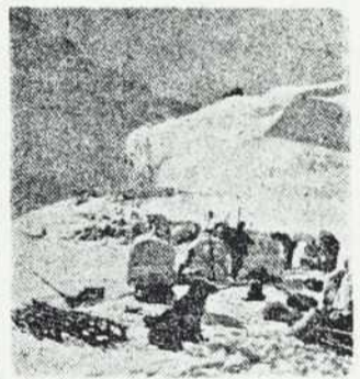
Ali bo tudi tu kdaj izginil »večni« sneg?

Na prvi pogled malce preveč drzna trditve! Toda angleški znanstveniki že sanjarijo o tem, kako bo na britanskih tleh zorela vinska trta ali morda celo