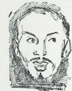
Ho Shi Minh, vodja odpora proti Francozom v Indokini

»mirovni kampanji« v Aziji. Medtem ko v Franciji na videz ne vedo, kako naj ravnajo, go- vorijo ameriška propagandna skozi usta zunanjega ministra Dullesa in nekaterih senatorjev o potrebi neposrednega ameriškega posre- dovanja v indokitajski vojni. Temu namenu tudi služil Dulleso- va najnovejša izjava, češ da ki- tajski tehnični svetovalci deluje- jo v Ho Ši Minhovih štabih. To naj bi bil »dokaz« o neposred-