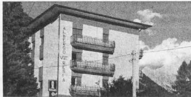
Hotel Val Resia a Prato - Ravanca