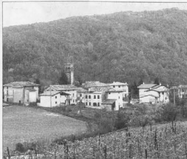
Pogled na Klenje iz Klančiča

Devetica je oživela tudi v špietarski fari an molil jo bojo tudi lietos.