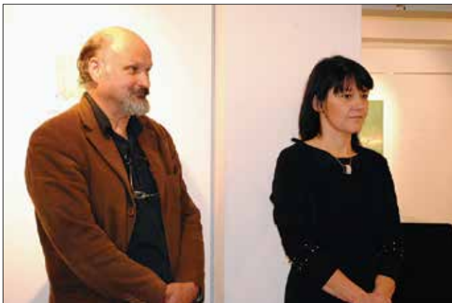
Dela Vinka Železnikarja je opisala likovna kritičarka Anamarija Stibilj Šajn.