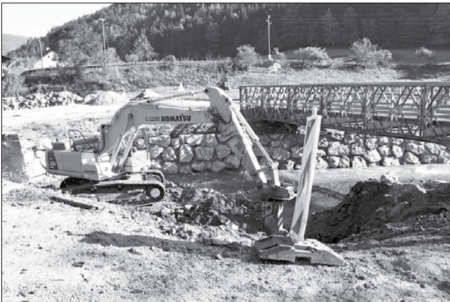
V začetku oktobra so začeli s terenskimi deli izgradnje Pažetovega mostu.

7. oktobra so stroji zakopali v brežino in strugo Ljubnice. Začela se je težko pričakovana izgradnja mostu, ki so ga v lanskih novembrskih poplavah poškodovale narasle vode. Ob pomoči Slovenske vojske so takrat poleg poškodovanega mostu, ki ga je bilo potrebno odstraniti, postavili montažni most, da je bil omogočen promet.