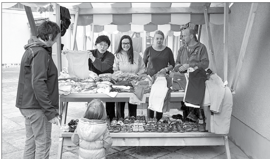
Stojnice so vabile k izbiri otroških oblačil, obutve in igračk.

Odziv staršev je bil pri zbiranju precej večji kot pri izdaji. V vrtcu so menili, da je bilo najverjetneje marsikomu neprijetno poseči po zbranih stvarih, četudi bi mu prišle prav. Pomanjkanja namreč nihče ne pokaže rad. Veliko zbranih stvari je zato pristalo v vrečah, ki so jih odpeljali Niki Rifej iz krajevnega odbora Rdečega križa. Zaradi slabega vremena tega letos niso opravili otroci, čeprav so se akcije zelo veselili.