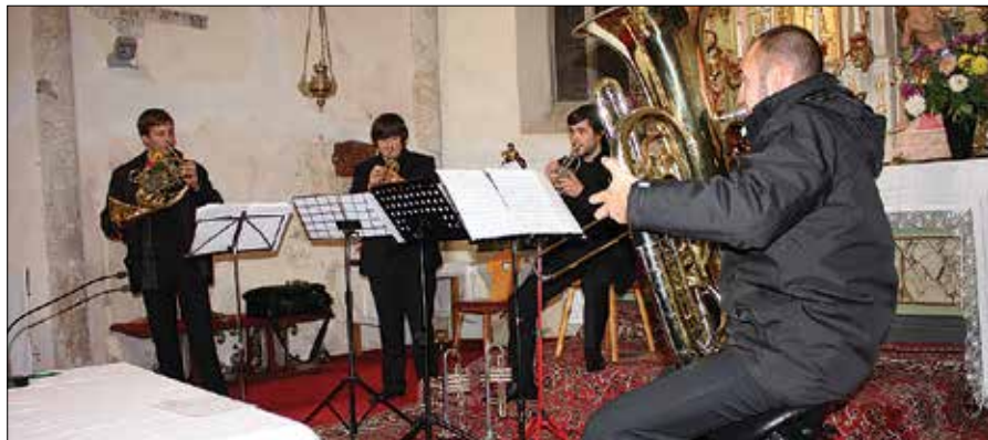
Nastop trobilnega kvinteta v solčavski cerkvi.