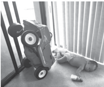
Tole se zgodi, če otrok vozi svoj avto in medtem pije ...

Lopovi med sabo priredijo tekmovanje, kdo je boljši zmikavt. Že imajo nekateri v rokah denarnice, žlebove in druge plene, ko pride mimo pokvarjen politik. „Čak, čak,“ se oglasijo nekateri jezno, „brez profesionalcev!“