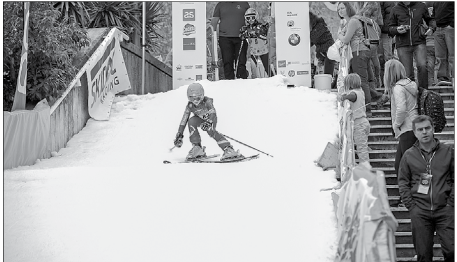
Na petdeset metrov dolgo in deset metrov široko progo do obale so se podali tudi mali smučarji iz Gornjesavinjskega smučarskega kluba Mozirje.