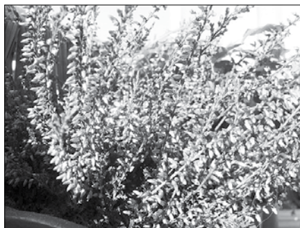
Jesenska vresa je znaniška jeseni.

Resa je grmiček z navzgor rastočimi vejicami in drobnimi igličastimi listi v vretencih. Na koncu vejic so v pokončnih enostranskih grozdih drobni cvetovi. Cvetovi so dolgi do pol centimetra v raznih tonih rdečkaste barve. Znanih je veliko sort. Razlikujejo se po bujnosti rasti grmičkov ter po barvi cvetov, ki prehajajo od bele do temno rdeče barve. Podobno kot vrese tudi rese vrtnarji barvajo v nenaravne barve.