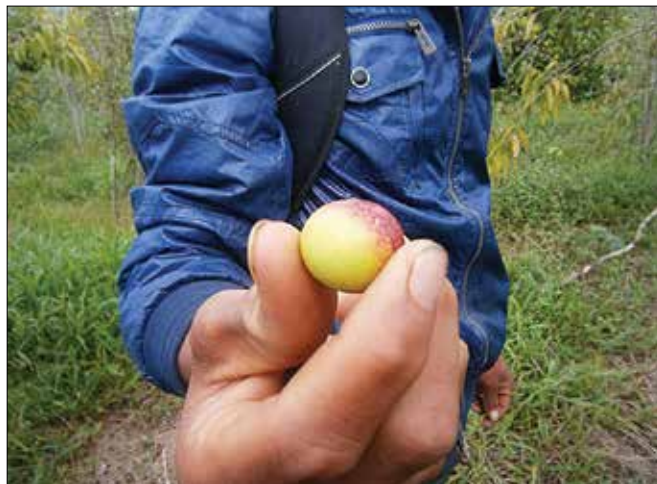
Camu camu velja za enega najboljših virov vitamina C na planetu.

Da bi se izognili zamašenemu nosu, glavobolu in prisilnemu ležanju v postelji, moramo okrepiti naš imunski sistem, to pa ni vedno lahka naloga. Že med letom moramo skrbeti za zaužitje za-