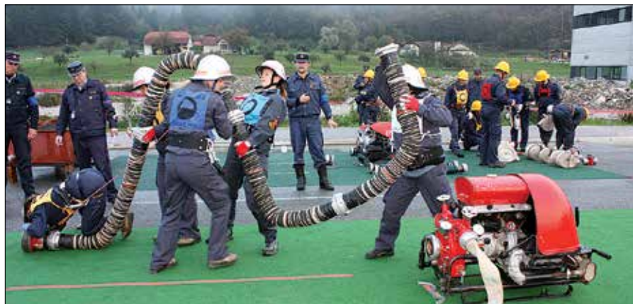
Na tekmovanju sta bila hitrost in natančnost ključnega pomena za dober rezultat.