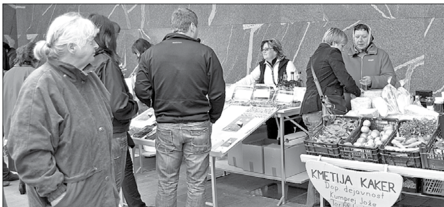
Med prejemniki diplom za uporabo blagovne znamke je tudi kmetija Kumprej, po domače Kaker iz Tera nad Ljubnim ob Savinji.

Ivica Orešnik, sodelavka Zavoda Savinja, ki je