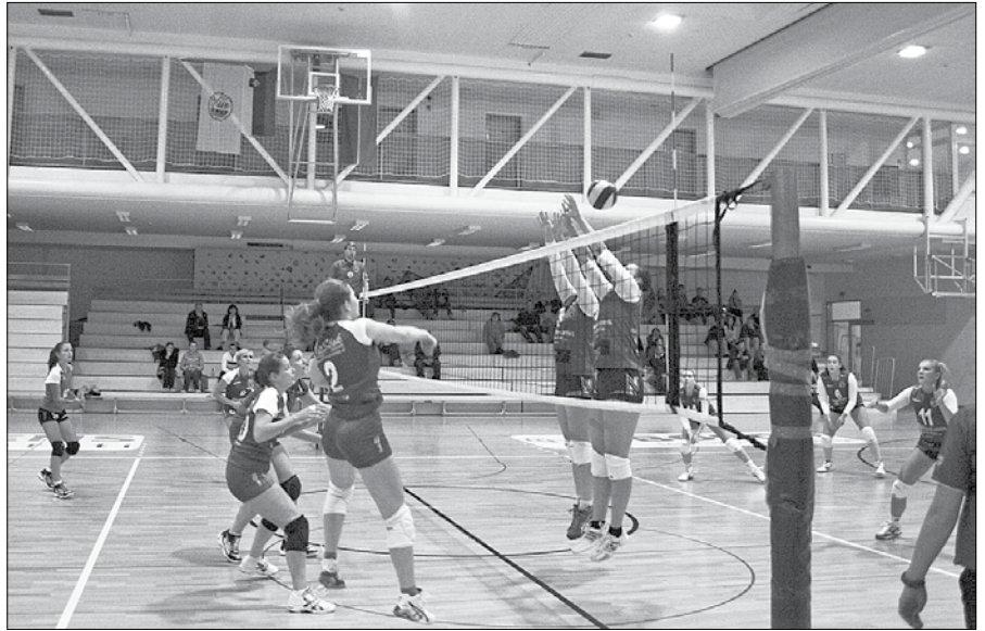
Mozirske odbojkarice so dobro začele tekme v drugi ligi.