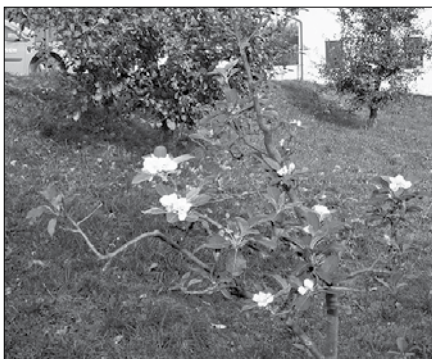
V teh dneh je v sadovnjaku pri Celinšku v Mozirju zacvetela jablana.