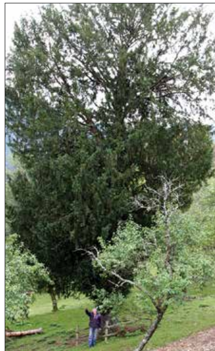
Otova tisa v Krnici je stara med 800 in 900 let.

Vodja nazarske območne enote Zavoda za gozdove Slovenije Toni Breznik nam je povedal, da je Otova tisa zares velika in zelo stara, da pa v Sloveniji še vedno prednjačijo nekatere druge.