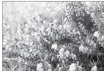
Spomladansko reso pogosto zasajamo na pokopališčih.

Spomladanska resa s strokovnim imenom Erica carnea , ki jo najdemo skoraj po celi Slove-