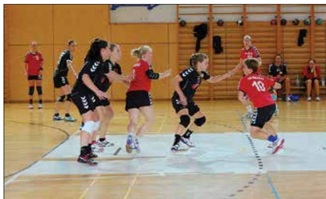
V drugem polčasu so se Nazarčanke izkazale z raznovrstno igro v napadu.

Sledila je napeta končnica, napetost so stopnjevale številne izključitve domačih igralk, kar so