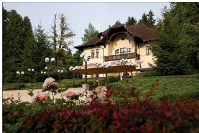
Lepo ohranjena in vzdrževana 160 let stara Vila Herberstein ima več kot štiridesetletno tradicijo namestitvene in kulinarčne ponudbe.