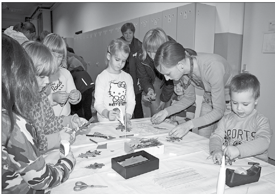
Otroci so naredili lasulje, verižice, medvedka in lutke.