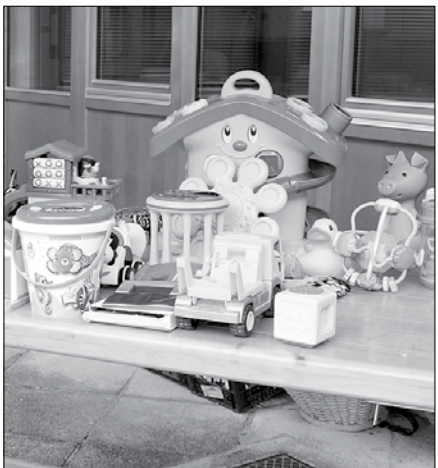
Turistično društvo je posodilo stojnice, kjer so zbrane stvari čakale na starše, da jih vzamejo za svoje otroke.

V gornjegrajskem vrtcu so ob tednu otroka pripravili več dogodkov. Ob tradicionalnem srečanju otrok in staršev ob prihodu tetke Jeseni so pripravili zbiranje in zamenjavo rabljenih oblačil, obutve in igračk. Stvari so zbirali tako v vrtcu kot na nižji stopnji gornjegrajske šole. Turistično društvo je posodilo stojnice, kjer so zbrane stvari čakale na starše, da jih vzamejo za svoje otroke oziroma za tiste, ki jih potrebujejo.