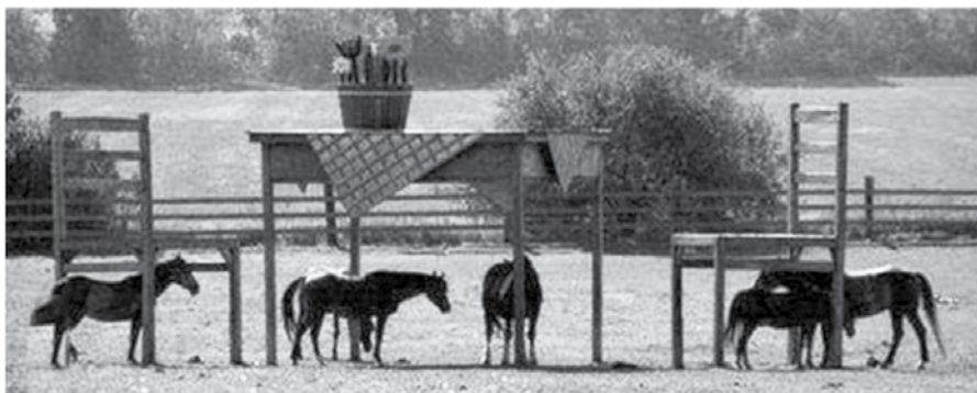
Lepo sem jih vprašal, ali lahko postavim hlev za konje? - Ne. Prav, ali lahko postavim mize in stole? - Lahko.

Včasih je bil dokaz, da ljubimo državo, to, da smo živeli v njej. Zdaj ko mnogi životarijo, še bolj.