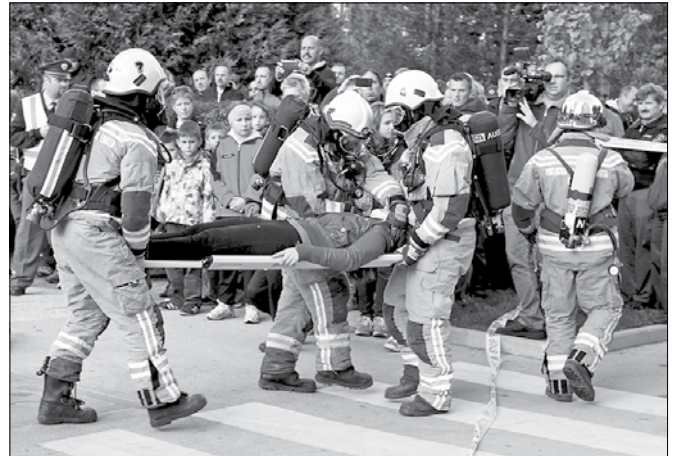
Ob prometni nesreči s prisotnostjo nevarnih snovi opravijo detekcijo in reševanje posebej za to usposobljeni gasilci.