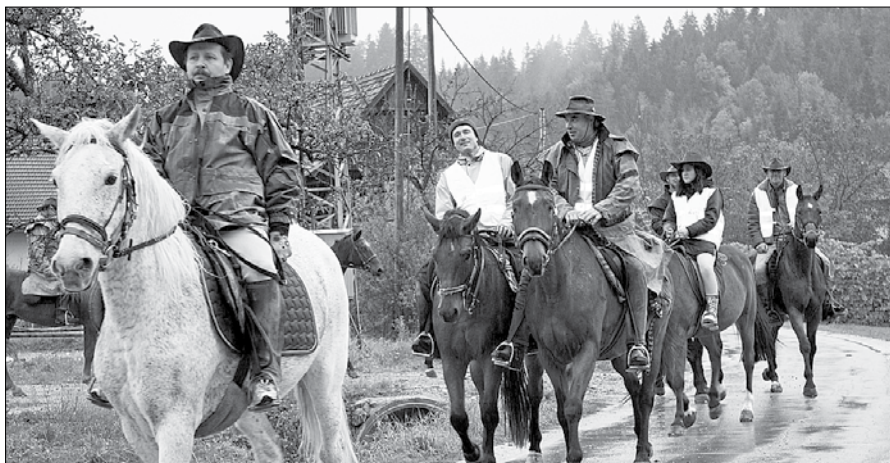
Konjenike so se na pohod odpravili v deževnem vremenu.