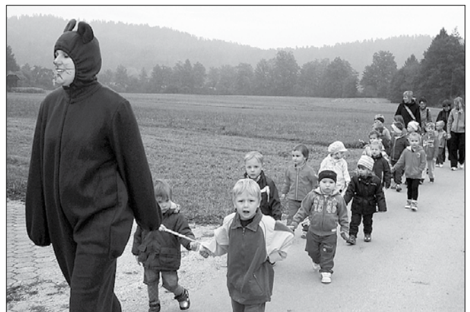
»Medved« je udeležence pohoda vodil do posameznih postaj, kjer so izvajali razne gibalne naloge.

stopinjah. »Medved nas je vodil do posameznih postaj, na katerih smo izvajali različne gibalne naloge. Na pohodu so se nam pridružili starši in stari starši. To nas še posebej veselilo, saj smo tako medsebojno spodbujali in bogatili medgeneracijske odnose,« ni skrivala zadovolj-