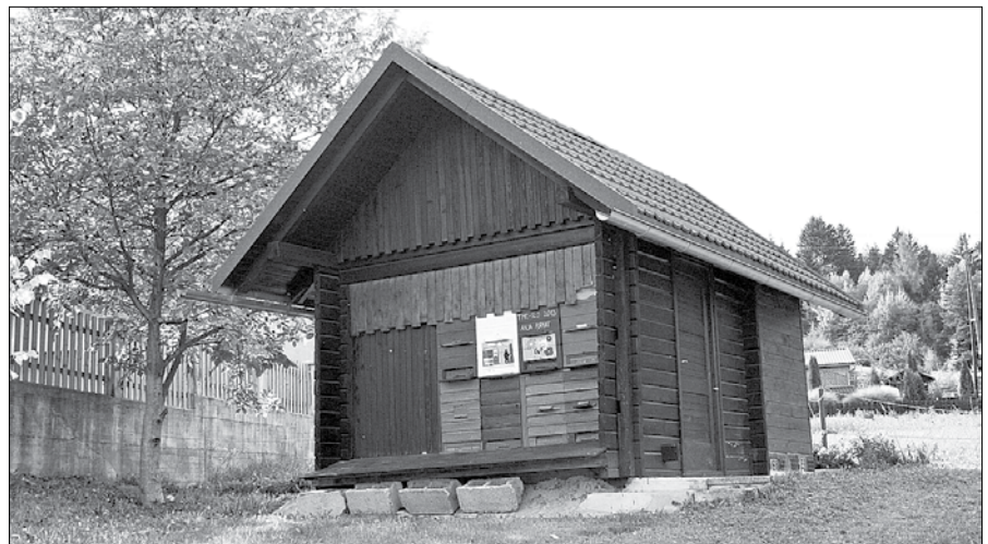
Čebelnjak, ki stoji ob mozirski športni dvorani, z novo strešno kritino.