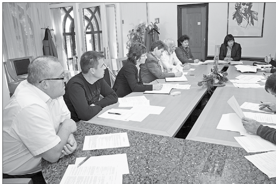
Po podanih izhodiščih in mestoma burni razpravi so udeleženci sestanka sklenili oblikovati ožjo delovno skupino, ki bo pripravila predlog financiranja športa.

Županja je uvodoma povzela nekatera dejstva glede sedanje situacije na področju financiranja klubov in društev ter plačevanja uporabe športne dvorane. Ta namreč posluje z izgubo. Županja je zatrdila, da se cenik, ki se uporablja od 1. septembra, ne razlikuje bistveno od doslej uveljavljenega plačevanja, kjer je bil v določenih primerih 50-odstotni popust na veljavne cene. Kljub veljavnim odlokom je po njenem mnenju upravljavec dvorane sam odločal, komu bo uporabo zaračunal in komu ne.