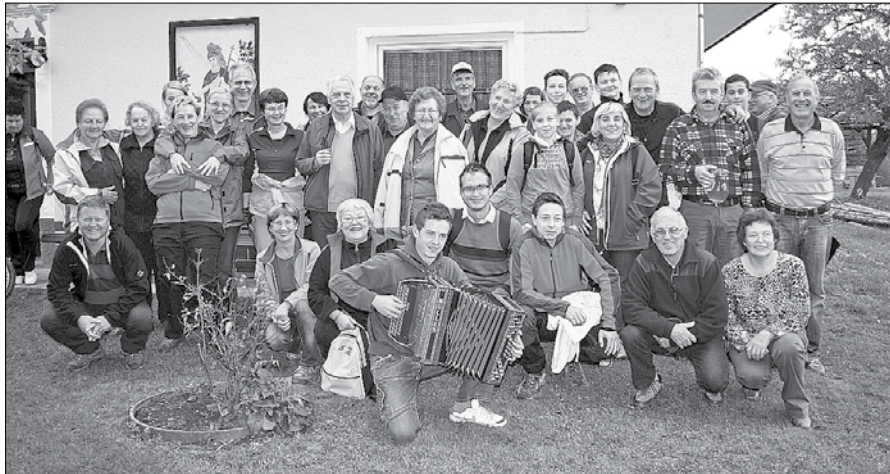
Na pohod se je podalo okoli petdeset Mozirjanov.