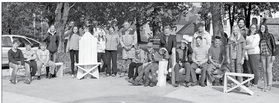
Udeleženci Jamnikove kolonije so bili ustvarjalni. Zadovoljstva ob zaključku kolonije niso skrivali.