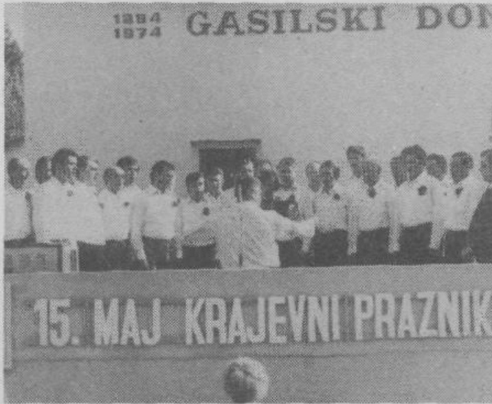
Moški pevski zbor KUD Bizovik na svojem prvem nastopu 15. maja 1976 ob praznovanju 10-letnice KS Bizovik.

Med navzočimi je bil tudi tovariš Benedičič, ki je poudaril,