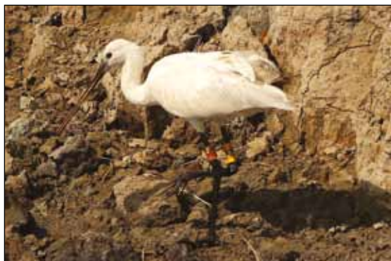
Slika 4: Žličarka Platalea leucorodia z barvnimi obročki, opažena na glinokopih pri Pragerskem dne 6.9.2008

Figure 4: Spoonbill Platalea leucorodia with colour rings, observed at Pragersko clay pit on 6 Sep 2008