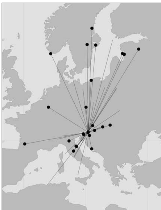
Slika 2: Pregled najdb ptičev, obročkanih na zadrževalniku Medvedce z okolico (SV Slovenija) in kasneje ugotovljenih po Evropi in Severni Afriki, ter najdbe po Evropi obročkanih ptičev in ponovno ujetih v Medvedcah z okolico; polni črni krogi pomenijo mesta obročkanja