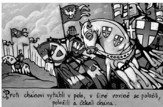
Slika 4: MATĚJÍČEK 2007: 7. Prevod besedila v oblačkih: Proti kanu so se odpravili na polje, po širni ravnini so se postavili in čakali na kana.

Stripovske ilustracije v obdelavi pesmi Jaroslav podpirajo, poživljajo in povečujejo dinamiko besedila in so predvsem demonstrativne, ilustrativne in dopolnjevalne. Besedilo pesmi je razčlenjeno na različno dolge dele, uporabljeno pa je kot vsebina posameznih oblačkov v stripu. Spekter barv v stripovski obdelavi pesmi Jaroslav se ujema z dogajalno linijo – prevladujejo odtenki modre barve (tudi v okvirih z besedilom), skupaj z rdečo (kri, barva zastav) in rumeno barvo (prah v nevihti in pri jahanju na konjih, sončna svetloba, ogenj). Tako omejen barvni spekter učinkovito priključuje temačno, grobo, bojevito in sovražno vzdušje. Značilnosti risb pustolovskih stripov so ohranjene tudi v upodobitvi lepe Kublajevne (v pesmi je opisana kot oseba, ki je »oblečena vsa v zlat brokat, vrat in prsi imela je odkrite, z biseri in dragimi kamni ovenčana« – str. 6). Zvest prenos tega besednega opisa v vizualno podobo delno pomika žanr pustolovskega in zgodovinskega stripa na področje erotičnih stripov.