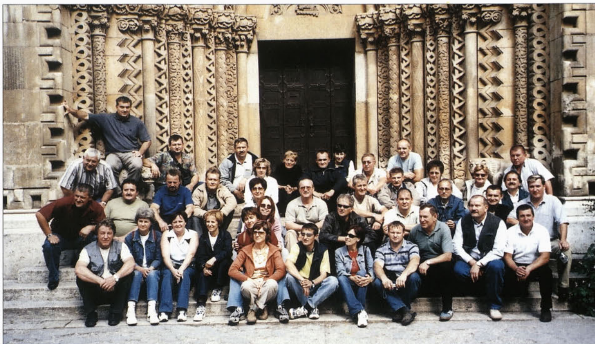
Kako čas beži. Skoraj pozabili smo že na prijeten izlet v Budimpešto.