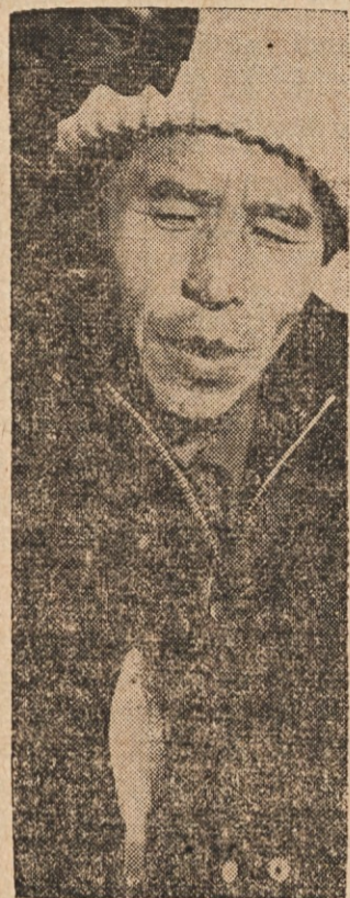
SLAB ULOV — Korejski ribič je v zimi lovil pri Seoulu, pa ni imel posebne sreče, kot kaže riba, katero je ujel.

prismodilo travo. Porjavela je in se drobila pod nogami. Zivina se je mogla pasti samo še v osolah in pa po močvirjih in goščavah.