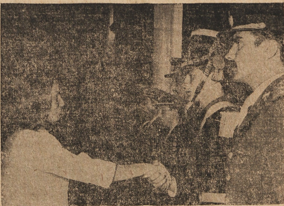
NJENI DNEVI NA ČELU ARGENTINE STETI? — Zabela Peron, predsednica republike Argentine, naglo izgublja podporo tako pri politikih kot v vodstvu oboroženih sil. Trdijo, da ne bo dolgo, ko bo morala iti, četudi se prizadeva, da bi ostala do konca svoje poslovne dobe prihodnje pomlad. Volitve novega predsednika bodo v decembru. Zabela je izjavila, da ne bo kandidirala. Na sliki jo vidimo, ko pozdravlja predsedniško stražo.

MOSKVA, ZSSR. — Predsednik vlade A. Kosygin je v svojem poročilu 25. kongresu Komunistične partije razlagal uspehe ZSSR v zadnjih petih letih in navajal področja, kjer je ZSSR pred ZDA. Navedel je potrebo po večji produktivnosti, ko bo rast delovne sile manjša. Gusa Halla, voditelja Komunistične partije ZDA, so na kongresu navdušeno pozdravili, ko je risal težave v ZDA in poudarjal predanost Komunistične partije ZDA Moskvi v nasprotju s komunističnimi partijami svobodne Evrope, ki so poudarjale na kongresu svojo neodvisnost od Moskve in "lastno pot" pri svojem delovanju.