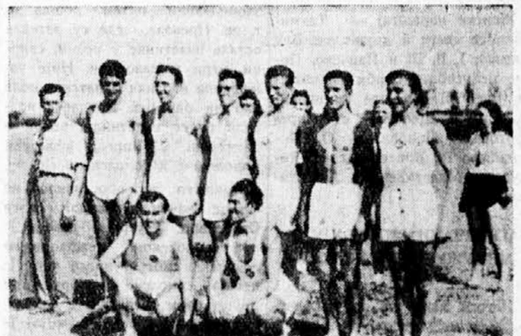
Fobednička vrsta društva Šabac, koja je osvojila pehar Sok. župe Beograd (vidi str. 4)

Engleski listovi javljaju, da je u Kairo, glavni grad Egipta, stigao ekspedicioni korpus za Palestinu, koji se sastoji iz nekoliko hiljada čeških i poljskih legionara. Isti listovi javljaju, da je preko Poljske dospela u Indiju jedna grupa od tridesetak čeških avijatičara, koji se sada nalaze na putu u Evropu, da se priključe češkim legijama u Engleskoj, ili na bliskom istoku.