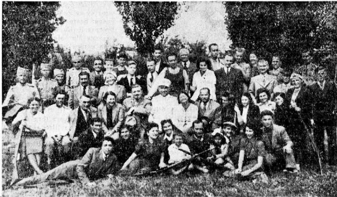
Streljački otsek Sokolskog društva Beograd-Matica (vidi članak u feljtonu)

Zašto mi dakle kličemo tako radosno: Da živi biskup Akšamović?! Da li zato, što je učinio nešto u specijalnu korist sokolstva ili našeg lista? Ni govora! Mi to činimo zato, što se, nakon duljeg vremena, ponovo javio jedan od najuglednijih predstavnika katoličke crkve u našem narodu, koji je ujedno i naslednik velikog Štrosmajera, da u katoličkom