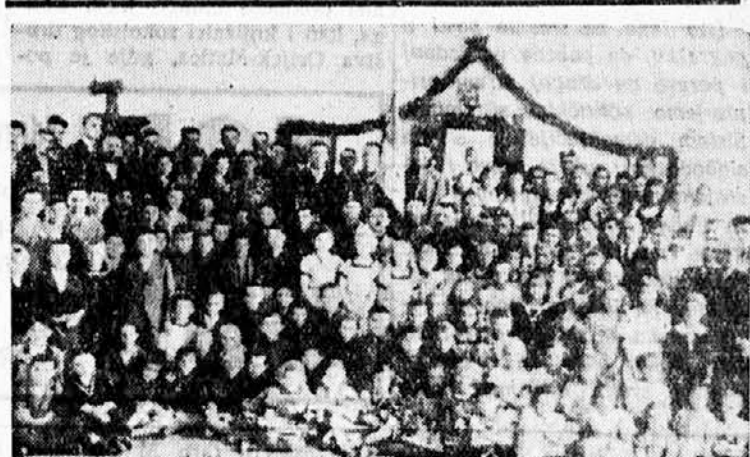
Sok. društvo Beočin slavi 6 septembar

»Nov dokaz kako brzo je preneto sokolska misao iz češke domovine po celom svetu jeste Sokolsko društvo u St. Luisu u USA, koje su osnovali češki iseljenici 1865 godine, samo tri godine posle osnutka matičnog Sokola u Pragu. Ovo društvo je proslavilo svoju 75-godišnjicu s velikim javnim nastupom, na kome je uzelo učešća i članstvo ostalih društava iz severne Amerike.«