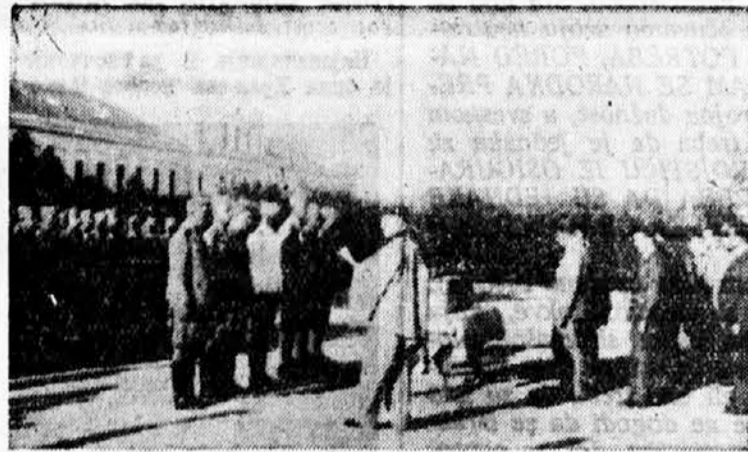
Sok. društvo Beograd - Matica predaje puškomitraljez II Pešadijskom puku (vidi članak u feljtonu)