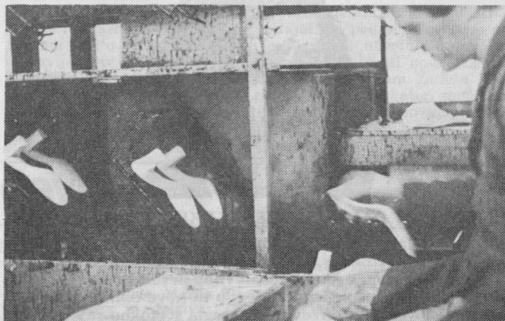
Barvanje podplato v tozdu Poliuretan

Enoglasno so podprli akcijo »imaš hišo — vrni stanovanje«. Delegati so zahtevali, da se ta akcija razširi na vse, ki imajo dve ali več družbenih stanovanj. Zahtevali so tudi, da to akcijo vodijo vsi subjektivni dejavniki v naši družbi in da o tem redno obveščajo delovne ljudi in občane. Akcija ne sme postati kampanja, ampak mora biti organizirana in dolgoročna.