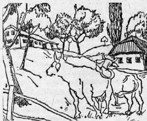
Kje je pastir?