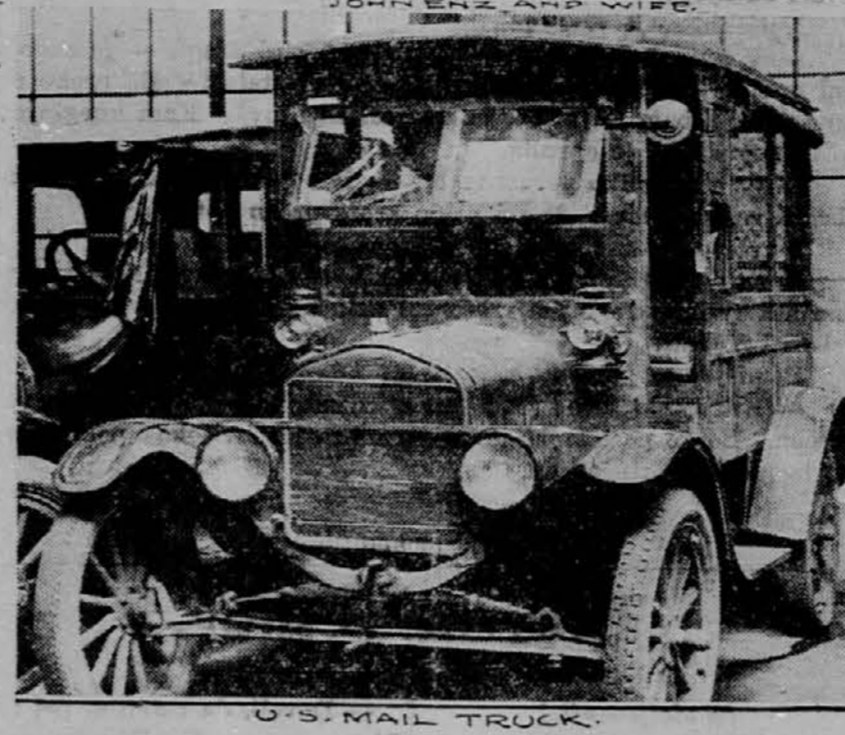
U.S. MAIL TRUCK.