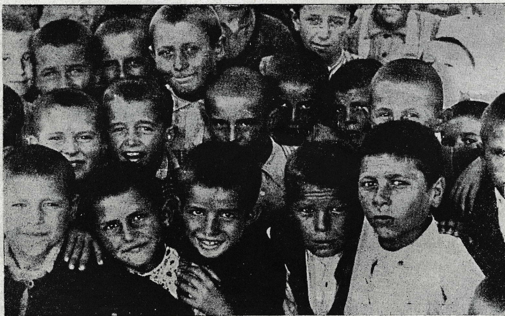
Uroševac: Nadobudna mladina, ki obiskuje tukajšnji mladinski dom

Tudi krožek lepo napreduje, posebno zdaj, ko imamo elektriko v hiši. Sestanki ob torkih so dobro obiskani; predavanja imajo krožkarji včasih že nekateri kar sami.