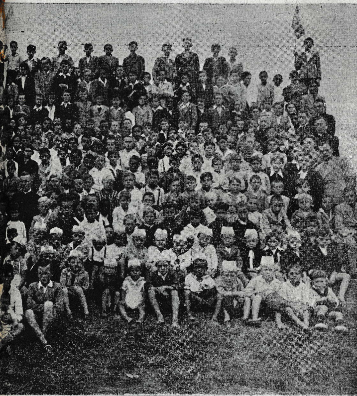
...nejšega oratorija v predmestju Ipojuca po skupnem ve... 1939. (Al. Zver.)

S. Paulo je največje industrijsko središče Južne Amerike in pravo delavsko mesto: ima 8.627 tovarn, v katerih dela približno 300.000 delavcev. Med to množico so maloštevilni člani KA, mladi delavci in delavke, začeli širiti letake, tiskara povabila, raznobarvne propagandne liste; razdelili so si mesto in večer za večerom po dva in dva, kot nekdanj Kristusovi učenci, obiskovali posamezna delavska stanovanja. Fantje so na ta način obiskali 7.400 hiš, dekleta pa 19.820. Lahko si predstavljate, na koliko težav in neprilik so naleteli ti Kristusovi junaki. Bog pa je blagoslovil njih trude: v raznih skupinah so pripravili in privedli