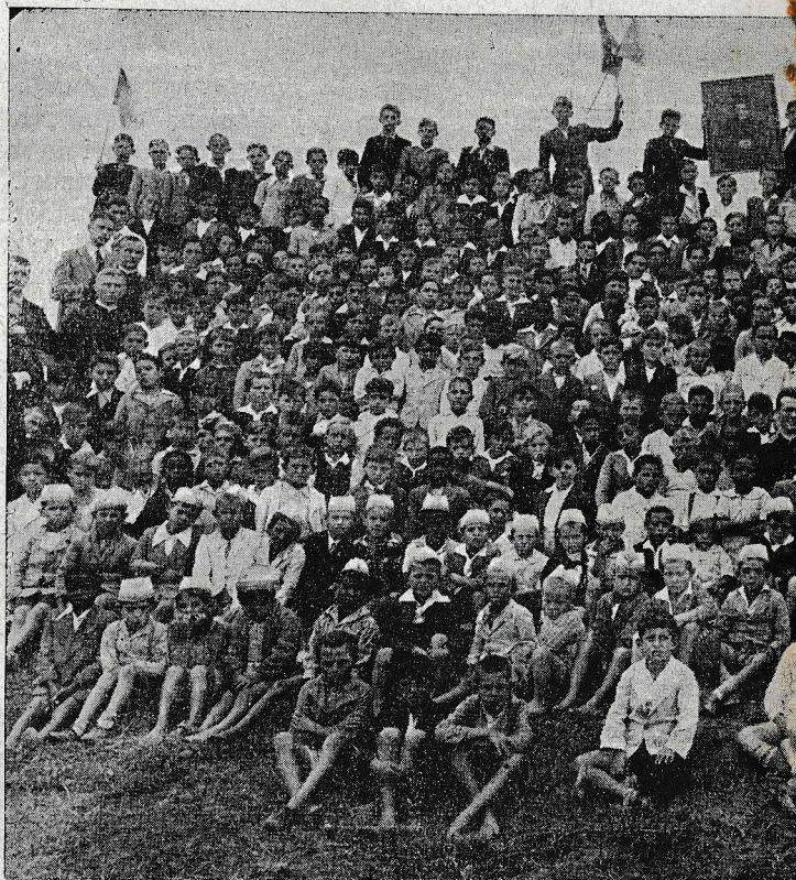
S. Paulo: Skupina oratorijancev najmlajšega in najrelikonočnem obhajilu