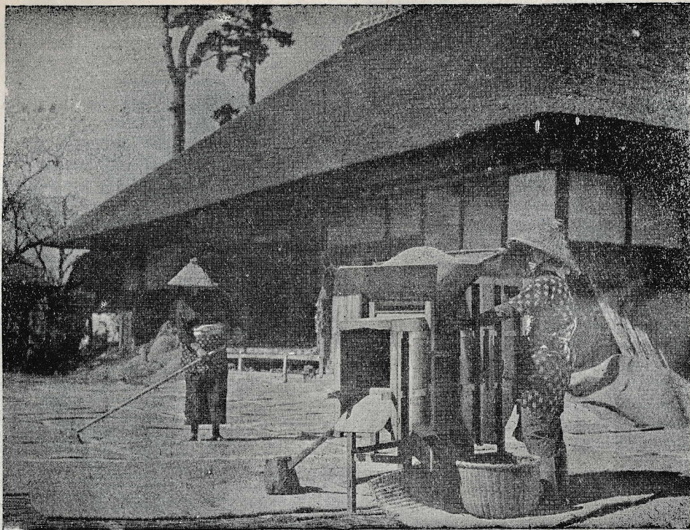
Japonske kmetice čistijo riž.

k velikonočnem obhajilu 15.428 svojih tovarišev delavcev, 215 odraslih so pripravili na prvo sveto obhajilo, 7 delavcev je bilo krščenih in 17 nepravilnih zakonskih parov pred oltarjem poročenih.