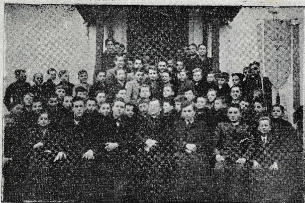
Murska Sobota: Marijina družba z zastavo

polna kakor pri našem prvem letošnjem nastopu.