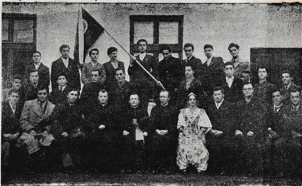
Prizren: Dijaška Marijina kongregacija v škofijskem malem semenišču

ljubezen, ki jo ima v srcu do te vzgoje potrebne, poprej tako zapuščene mladine. V pozdravnem govoru ga je ravnatelj zavoda zahvalil za požrtvalno skrb, katero ima on in osebje banske uprave za ta zavod.