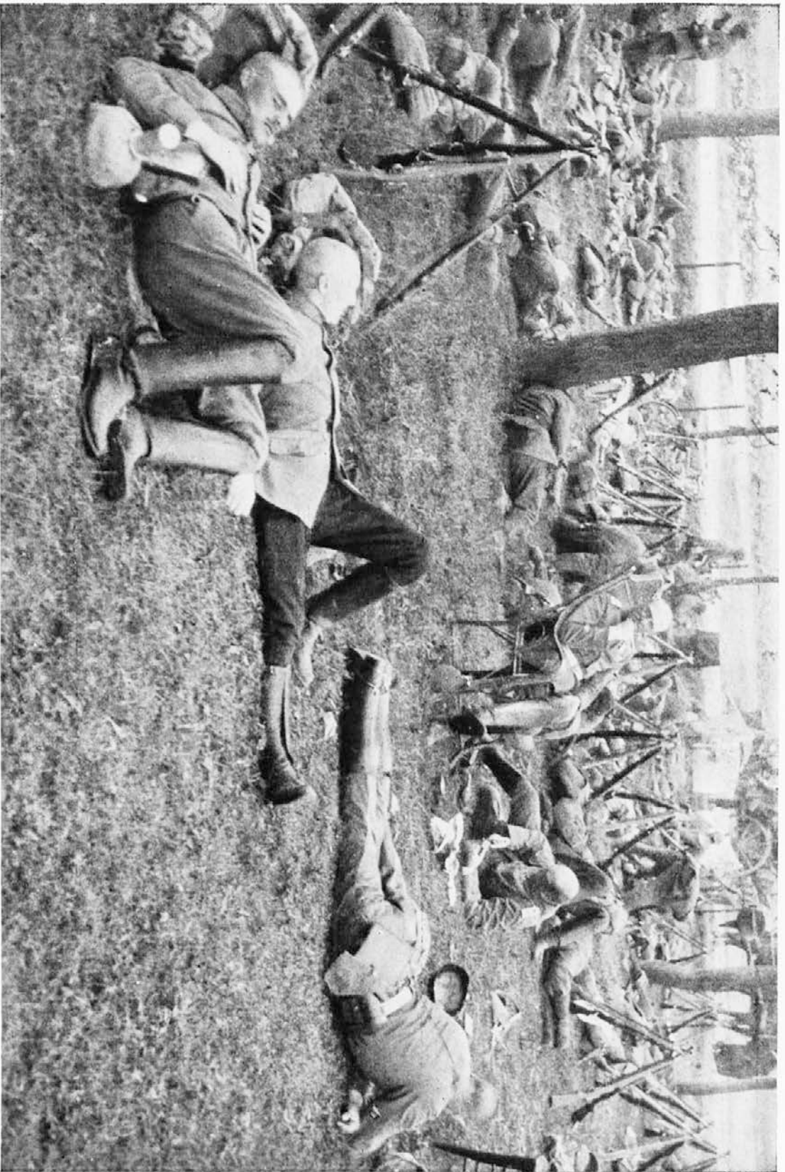
Vojaki počivajo po hudem boju.