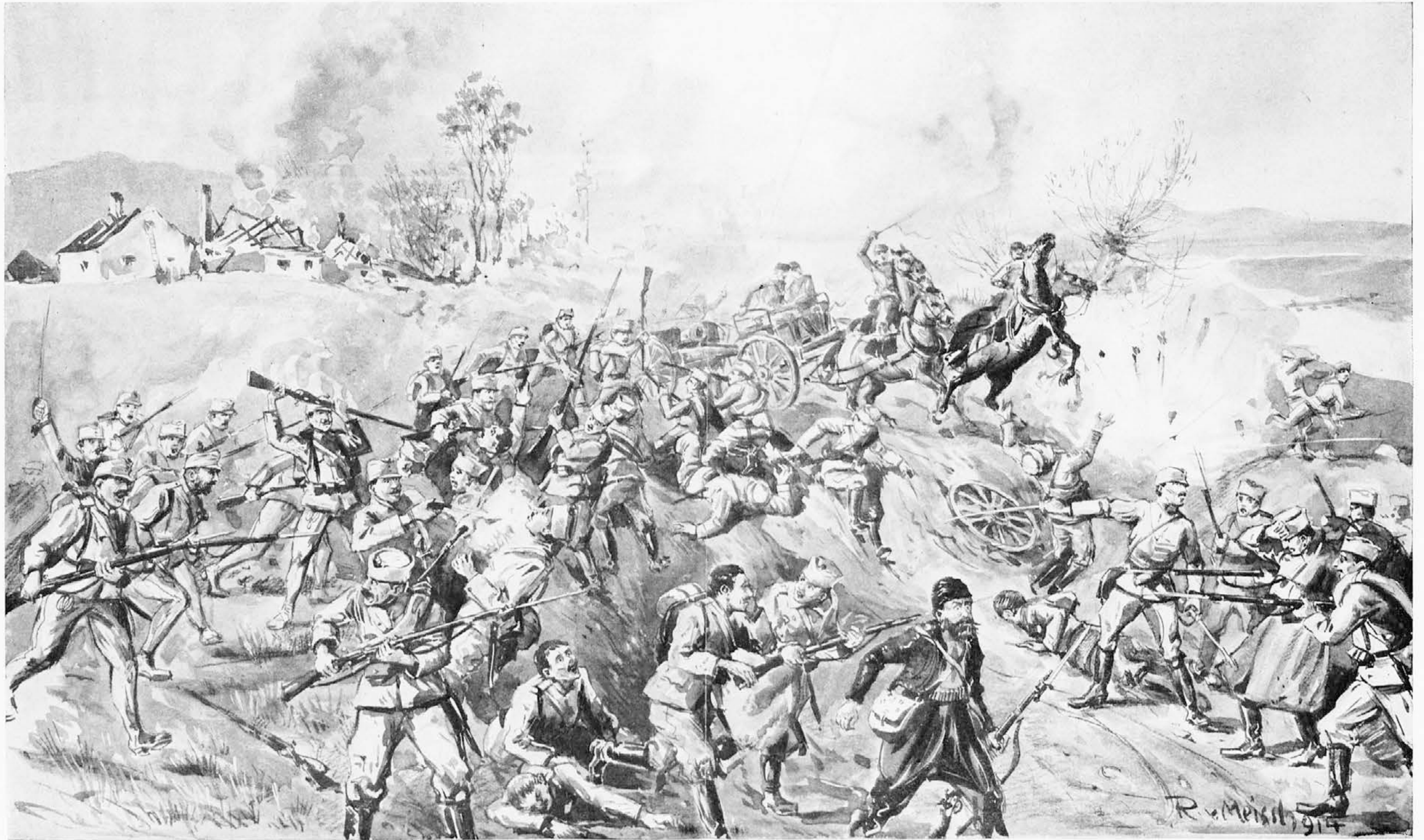
Naše čete uničijo srbsko timoško divizijo. Popis tega boja prinese eden prihodnjih sešitkov.