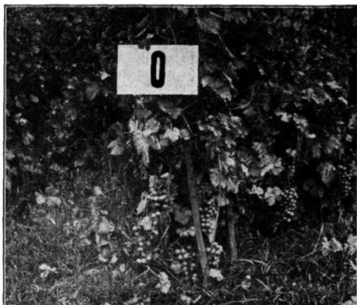
Slika 3. in 4. Uspeh gnojilnega poskusa pri žlahtnini v Ljutomeru na oralu:

KPN = S polnim gnojenjem: O = brez gnojenja