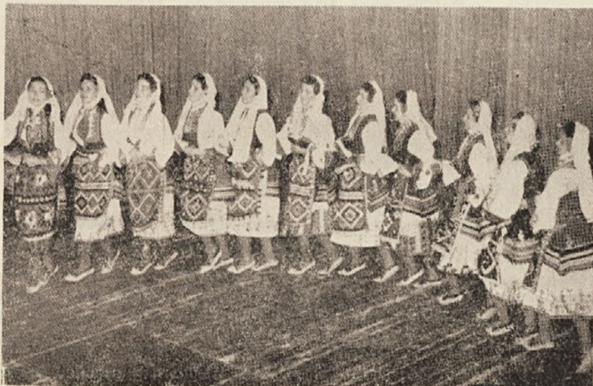
Folklorni ansambel «TANEC», ki bo nastopil v Dolini