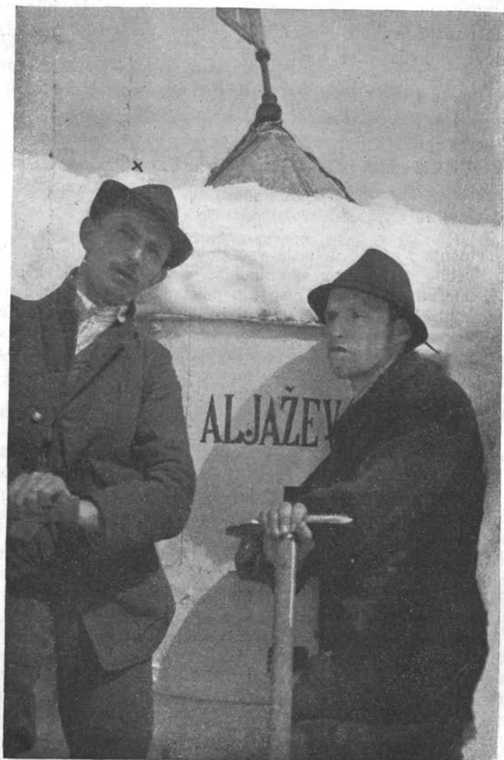
V snegu vrh Triglava. (X Dr. Cerk).

kvišku proti grebenu Čela, kjer je bila pač najbližja, a gotovo tudi najstrmejša smer. Ko so se dvigali že v višine pod Čelom, so prišli na popolnoma zledenel sneg in daljnja pot je postala silno opasna.