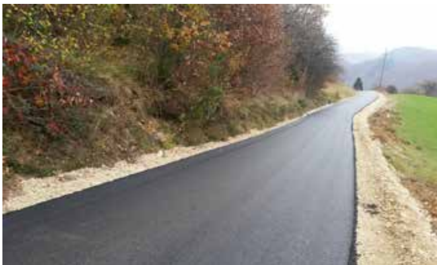
Cesta po zaključku del