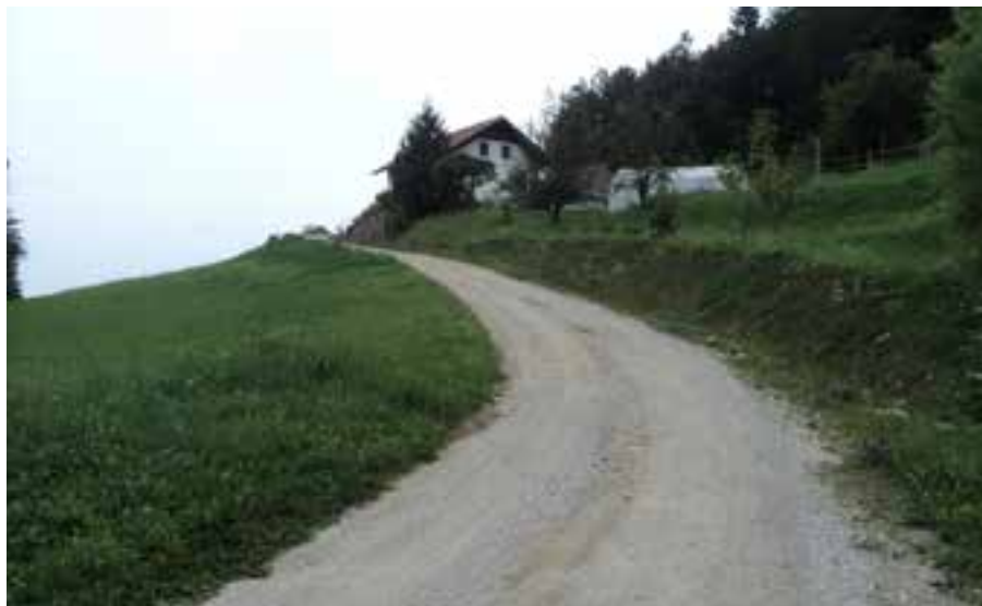
Cesta pred gradnjo