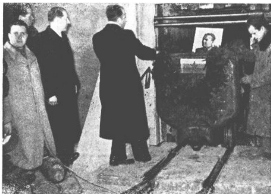
Prvi voziček je zapustil novi jašek