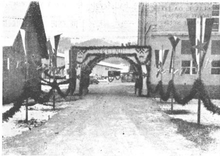
Vhod k novemu jašku na dan o'vori've