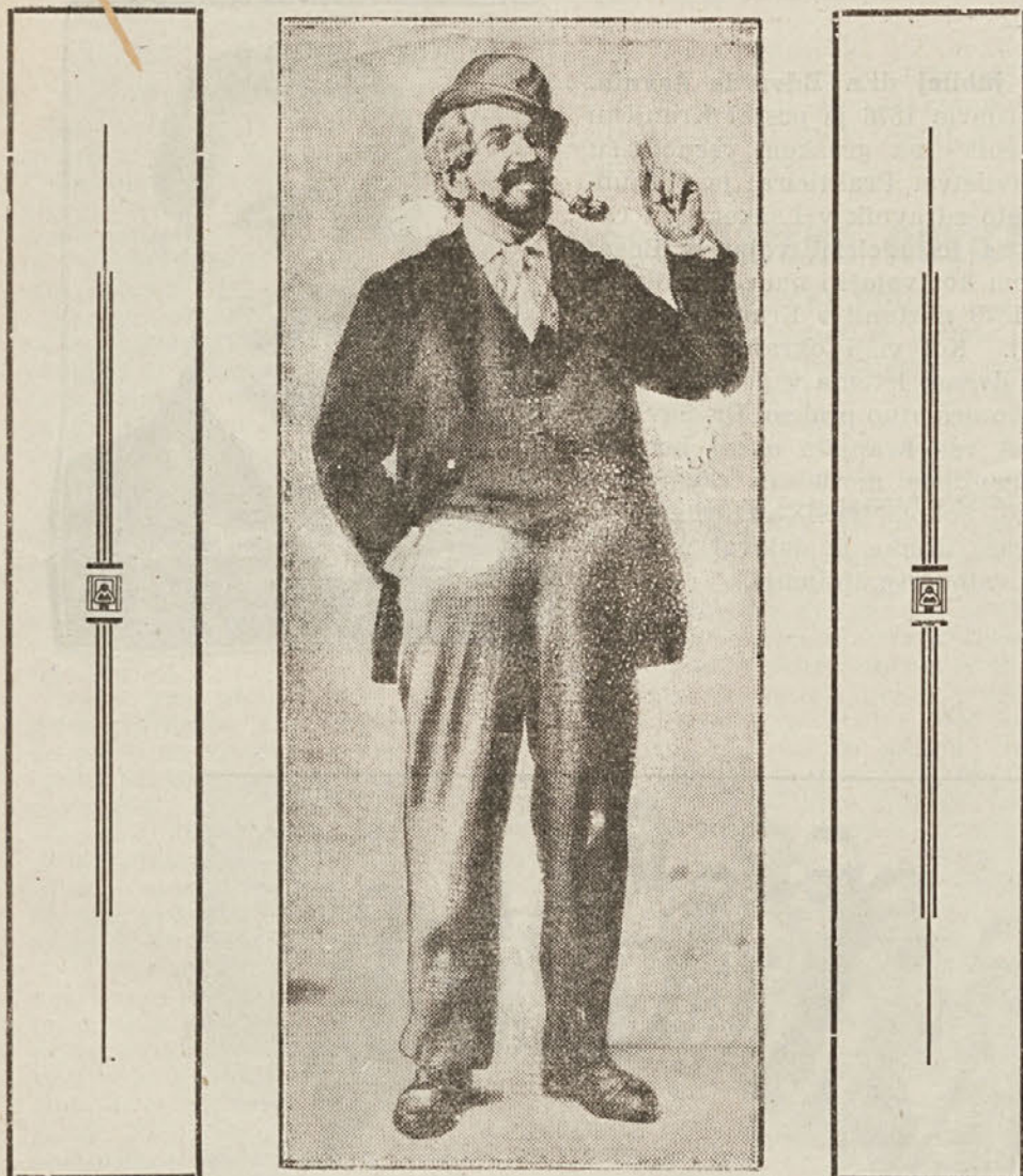
JUBILAR A. C. DANILO.

Rojen je bil 15. julija 1858 v Ljubljani, star je torej 68 let, letos praznuje 50 letnico svojega igralskega delovanja.