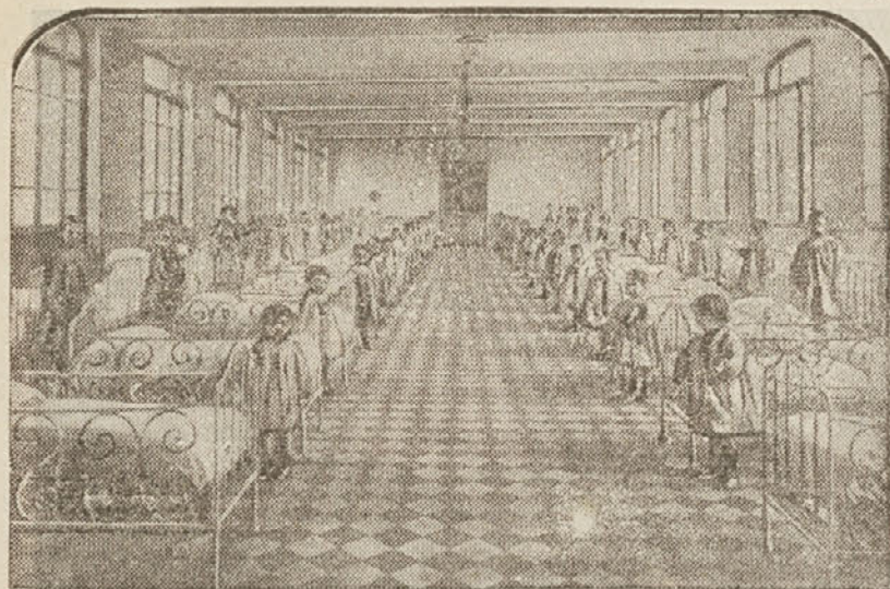
Vzorno urejen Dečji dom za negovanje in vzgajanje revnih otrok, kakršnega imamo po zaslugi Slovenk tudi v Ljubljani