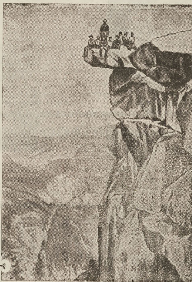
Najvišja pečina Severne Amerike, katero zelo radi obiskujejo izletniki, d'as tem pokažejo svoj pogum. Mnogo jih pa zleze na to nevarno pečino, ki je visoka čez 3000 čevljev, tudi zato, da si končajo svoje življenje na popolnoma gotov način s skokom v globino.