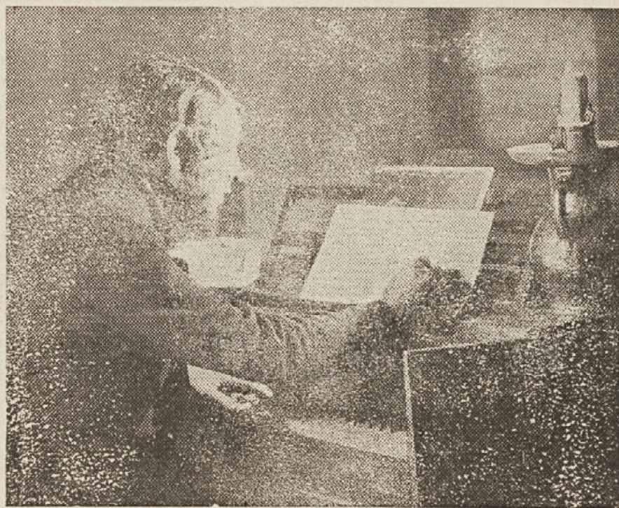
Češki skladatelj František Škroup, ki je uglasbil pesem «Kje dom je moj?». Pesem je postala češkoslovaška narodna himna ter jo prepevajo vsi Slovani.

Posnemali Te bomo na žilavosti pri našem napredovanju na polju umetnosti in kulture sploh!