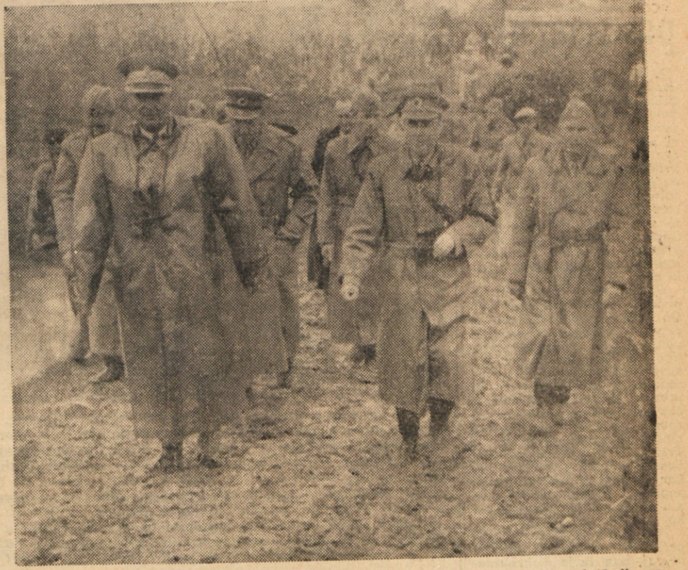
Z velikih manevrov Jugoslovanske ljudske armade. Maršal Tito je po enurni hoji po bližnji poti prišel v prve vojne vrste.

(Od našega posebnega dopisnika) ZAGREB, 25. - Inozemske delegacije so dale o manevrih Jugoslovanske ljudske armade zelo pohvalne izjave. Vodja francoske vojaške delegacije general Carole je izrazil zadovoljstvo, da je ponovno lahko videl hrabre jugoslovanske vojaške, ki imajo slavne tradicije iz prejšnjih vojn... (The rest of the article text follows in a similar pattern)