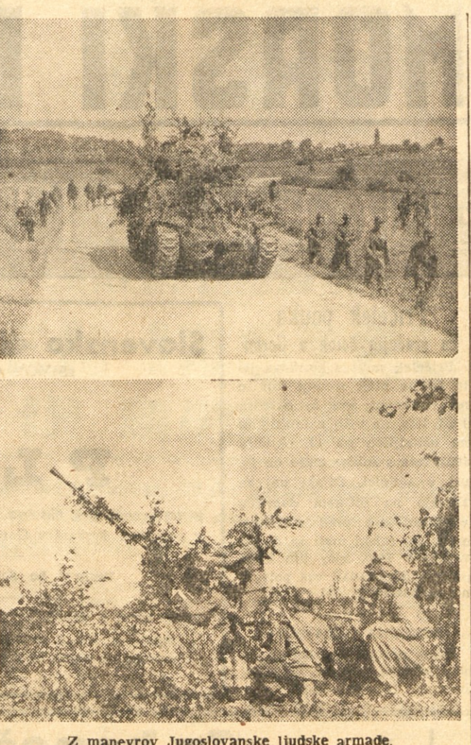
Z manevrov Jugoslovanske ljudske armade.