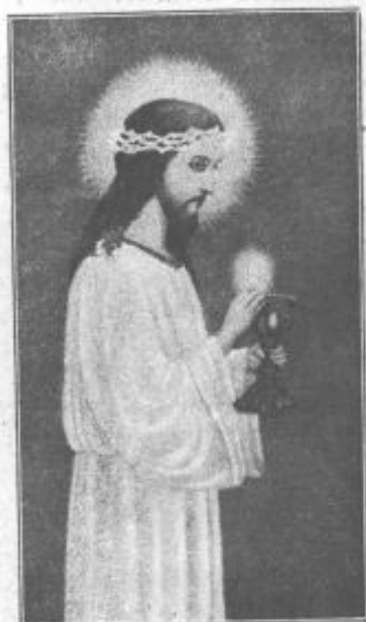
Dšša, ľubi Jezusa, ki te s sa nim sebov hrani.

Ga ľubiš? Ščeš znati, Ka si dšša po njem doľila? „Dobili ste dšha posinovenja, v šterom zazavamo Abba, Oča.“