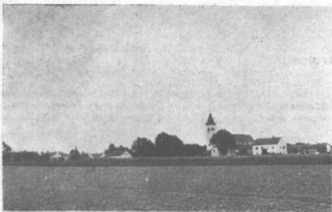
Marijina carkev v Turnišči, v štero se po gorečnosti vernikov v kratkom postavijo orgole za stopet jezer dinarov.

Sv. Ivan jako dobro prispodabla svet s püščavov. Püščava je navadno nerodovitna, süha, stan razbojnikov i zverine. Zato je nevarna za človeka, zna v püščavi zabloditi.