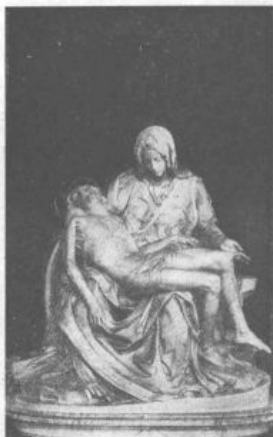
Marija, mati žalosti, reši nas večnoga pogübljenja. Podoba Michel Angeloja v cerkvi sv. Petra v Rimu.

Vi morate priti do spoznanja. Je med vami takši, šteri bi raj meo pekeo kak pokoro? Joj, če bi samo eden bio, te bi s tem jasno dokazao, da resno ešče nikdar ne premislo, kakše je strahovito pogüblenje. Ne zamerite mi zato, če jaz to jütro vse drügo pri strani püstim i se omejim samö na to, da vam opišem pogüblenje.