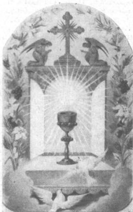
Eto je veliko Svestvo.

Njega. Sveta meša je sunce i središče naše vere, prave vere. V njej i po njej prikažemo Bogi neskončno molbo, hvalo, prošnjo pa zadoščenje za grehe. Sveta meša je nekrvavo ponavljanje Gosподove križne smrti. Kristuš je pri njej duhovnik i daritev. Če svet ne bi bio rešen, bi ga rešila vsaka sveta meša. Vretina je križ na Golgoti, žleb je oltar, a zveličanje prinaša rešilna i čistilna krv Jezušova tak na križi, kak na oltari. Po duhovniki se pozove Jezuš na svet i ga boga. Neskončna lübezen za človeka pride na svet, da se mesto njega darüje Bogi v zadoščenje za njegove grehe, da ga prosí potrebne milosti za zveličanje, da njemi da hvalo za doblene milosti i da