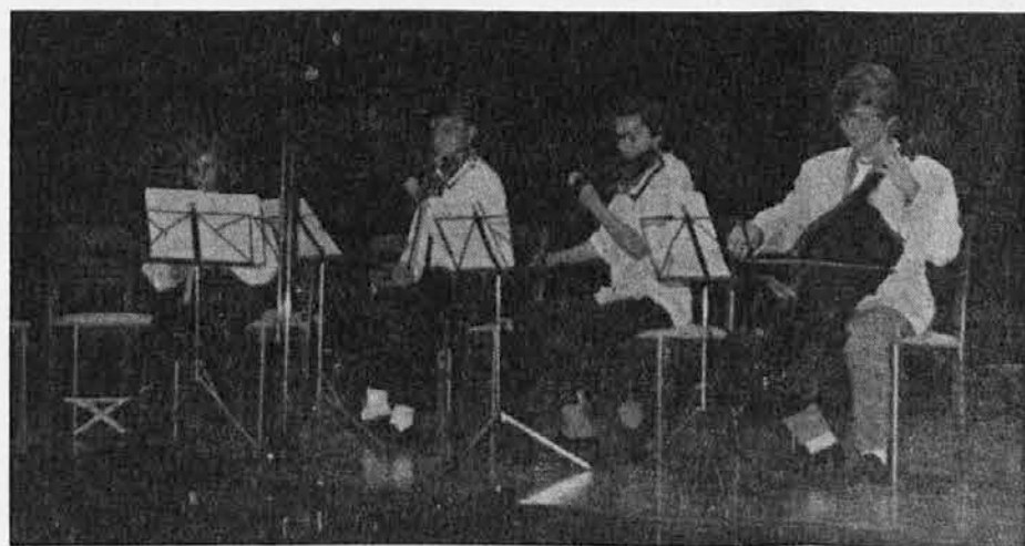
Kvartet na zaključnem nastopu v Katoliškem domu