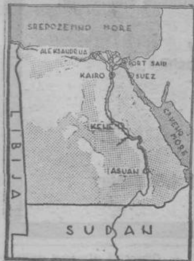
Egipt obsega milijon kvadratnih kilometrov površine in šteje 23.200.000 prebivalcev. Kmečko prebivalstvo predstavlja 70% vsega

prebivalstva. Od aktivnega prebivalstva Egipta je 60% aktivnega v kmetijstvu. Kmetijstvo je leta 1953 obdelovalo v nacionalnem dohodku, ki je znašal 856 milijonov egiptovskih funtov, s približno 27%.