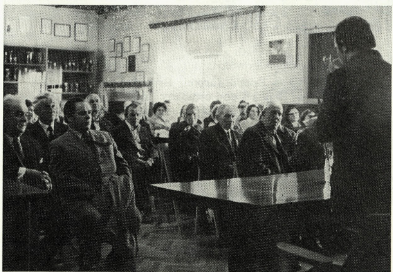
Pozdravni govor našim gostom