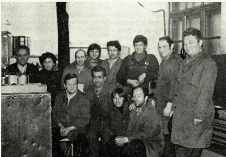
Sodelavci v prototipni delavnici industrijske opreme