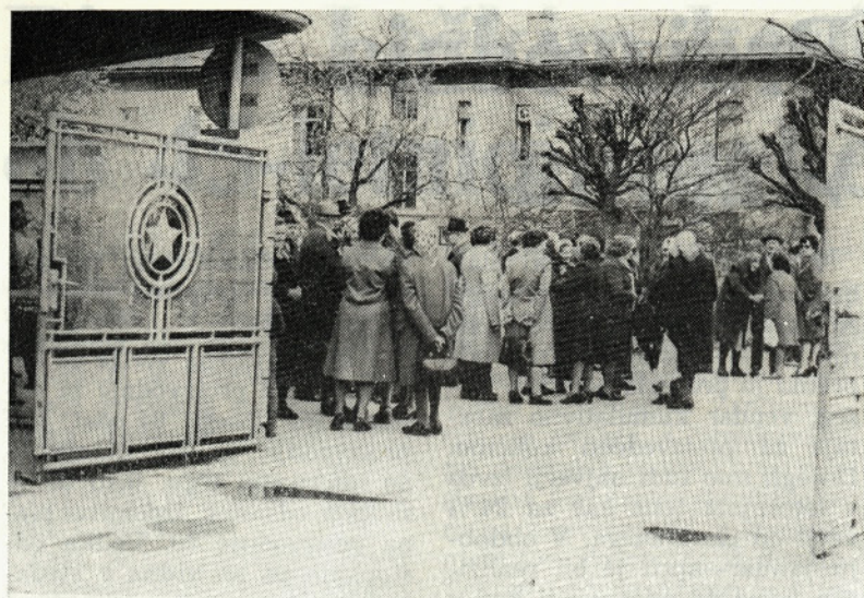
Naši upokojevcji so se zbrali pred vhodom tovarne