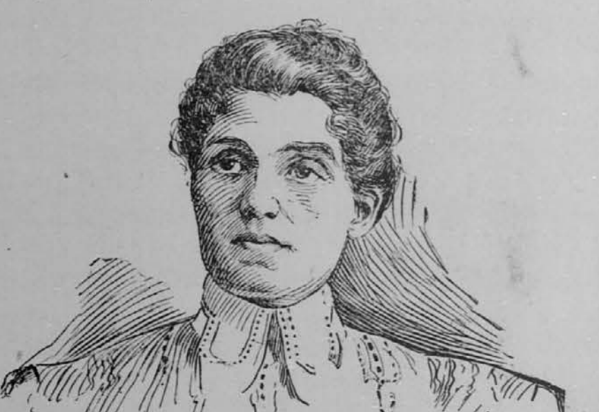
Zdravniku specialistu, ki me je ozdravil prsne bolezn, kroničnega bronhijalnega katara, telesne slabosti, kašlja, potenja po noči in pomanjkanja teka, se tem potom najprisrčneje zahvaljujem. Bila sem prej pri 6 zdravnikih, ki mi niso nič pomagali. V univerzalnem zdravniškem zavodu sem popolnoma ozdravela v enem mesecu. Zato najtopleje priporočam vsem bolnim ženskam, da iščejo pomoč tam, kjer jo dobe gotovo. Obrnejo naj se pisмено ali naj osobno povprašajo, kako bi bilo mogoče ozdraviti. V univerzalnem zdravniškem zavodu v New Yorku ozdrave gotovo. Prostovoljno pustim to izjavo, da se objavi v časopisih. Bayonne, N. J., 24. julija 1903.

Jamčimo vam za popolno ozdravljenje vseh bolezn, kakor: bolezn na pljučah, prsih, želodcu, črevah, ledvicah, jetrah, mehuru, bolezn v grlu, nosu, glavi, nervingnost, živčne bolezn, prehudu utripanje in bolezn srca, katar, prehlajenje, naduho, bronhijalni, pljučni in prsni kašelj, bljuvanje krvi, mrzlice, vročino, težko dihanje, nepravilno prebavljanje, revmatizem, giht, trganje in bolečine v križu, hrbtu, ledjih in boku, zlato žilo, grižo ali preliv, nečisto in pekvarjeno kri, otekle noge in telo, vadenico, božjast in sploh VSE ŽENSKE IN MOŽKE BOLEZNI.