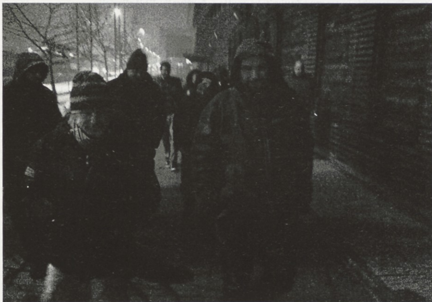
Po prvi zasedbi Vibe

Deklarativna odklonilnost do slovenskega filma ne glede na dosežke, nagrade in poznavanje situacije spodbuja in krepi predsodke pri ljudeh. Slovenski film je slab, moja točka pričakovanja je ničelna, torej mu ne dam priložnosti, tako suvereno ohranjam lastno nepremakljivo prepričanje. Konstruktivna kritika pa zahteva premislek in poznavanje tematike in ne služi destrukciji zaradi nje same. Glede na to, da je med vsemi ustvarjalnostmi avdiovizualna danes najmočnejša, najhitrejša in najdostopnejša, sta vzgoja in izobraževanje ključna za kakovostno in kompetentno presojanje informacij in del tako v smislu vsebine kot forme. Zato mora