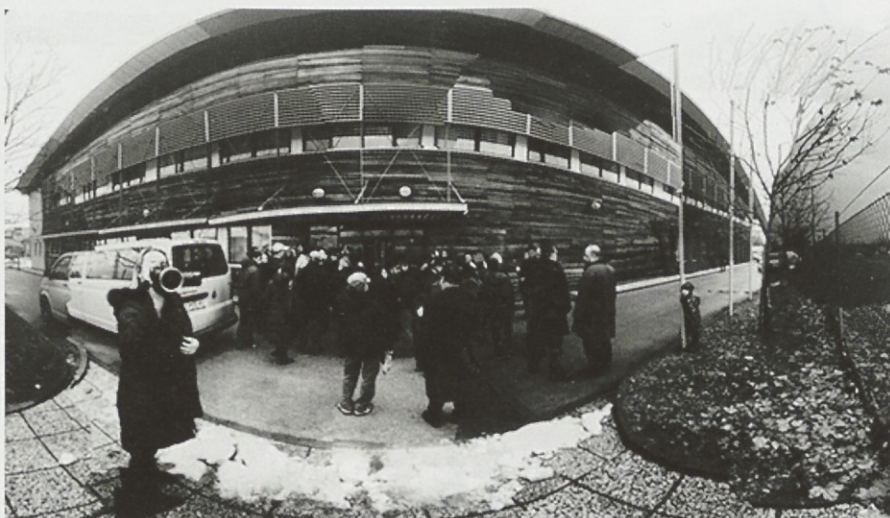
Pred zaklenjenimi vrati

sindikatom, ki se borijo za svoje pravice, ni uspelo nadgraditi z vizijo, kako pripomoči k celostni, tudi finančni viziji rešitev. Pravzaprav se filmska iniciativa ni začela s »povratkom« Prodnika oziroma z njegovim nedavnim imenovanjem na mesto direktorja Vibe. Iniciativa je tu že ves čas. To imenovanje je zgolj povod, da se je spontano zbrala velika večina nas, ki smo med vsakodnevno borbo za preživetje uvideli, da če ne stopimo skupaj in preprečimo takšne samovolje, v zelo kratkem času ne bo snemal nihče, ker filma preprosto ne bo več.