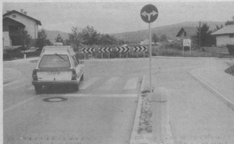
Cesta, ki se nenadoma konča, ker mestni sklad stavbnih zemljišč še ni odkupil nekaj parcel. (Slika: Zdenko Matoz)

Predvsem je treba pojasniti nekaj. Vse pisanje in prerekanje okoli sklada stavbnih zemljišč ni le prepričevanje med uradniki z različnih ravni državne uprave. Preprosto povedano, gre za ogromne količine denarja. Zato se upravičeno postavlja vprašanje, koliko občani skladu pošljejo denarja in kaj za to dobijo.