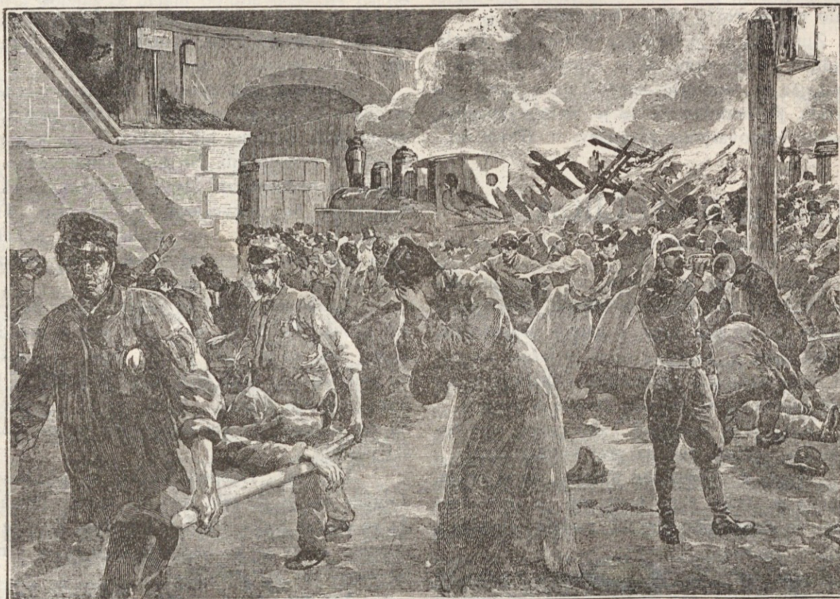
Nesreča na železnici.

»Kdo? Ne razumem te! Povej mi no vse, zaupaj mi in lažje boš prenašala, kar te teži, sem rekla jaz.