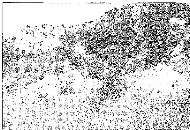
Jugozahodno pobočje Badina nad Sočergo, življenjski prostor mnogih mediteranskih vrst žuželk. Southwestern slope of Badin above Sočerga, where many Mediterranean insect species find their home.

Gerris najas (DeGeer, 1773) EM Osp, izvir Rižane, Mlini Gerris paludum Fabricius, 1794 ES Petrinje