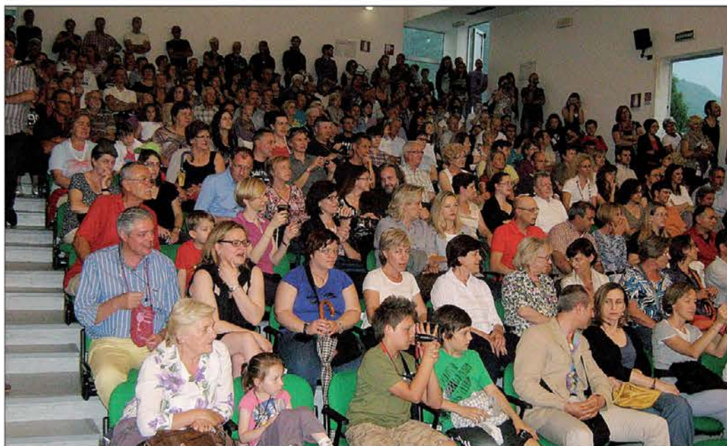
Večnamenska dvorana je bila kot ponavadi polna

nje pa se je zaključilo v Benečiji. Čestitke zaslužijo vsi, tako igralci kot učitelji in učiteljice, ki so jih lepo pripravili za ta lep trenutek, ki naznanja konec šolskega leta.