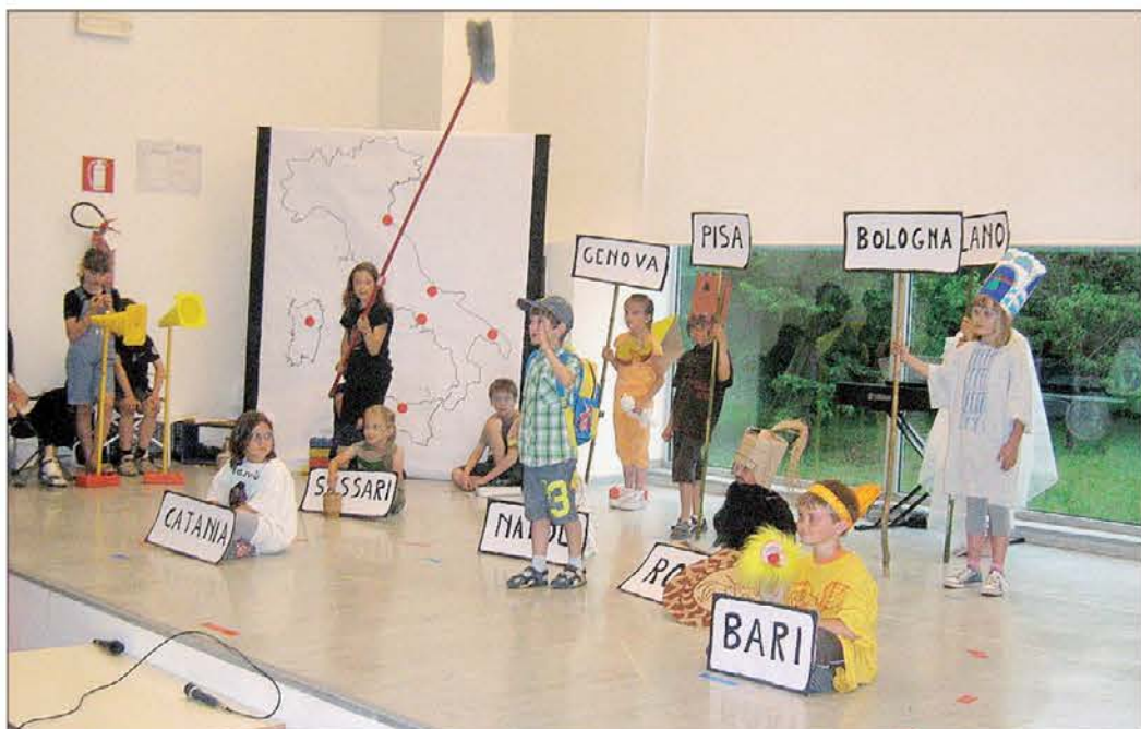
V Italiji v miniaturo so se mesta nenadoma pomešala...