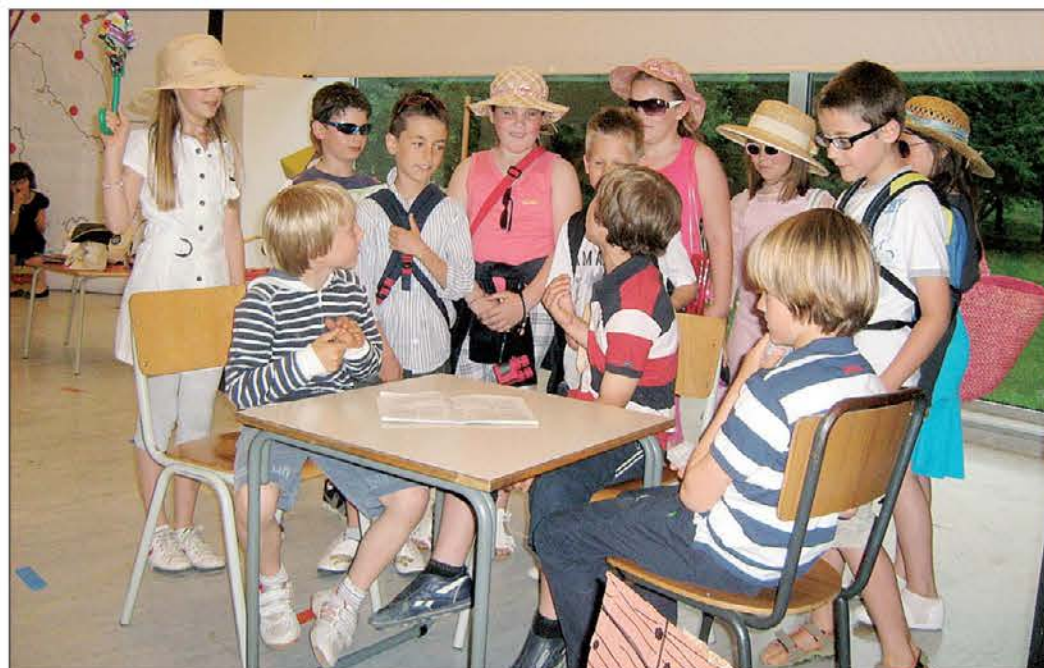
V Benetkah se večkrat zgodi, da turisti o mestu vedo veliko več kot domačini