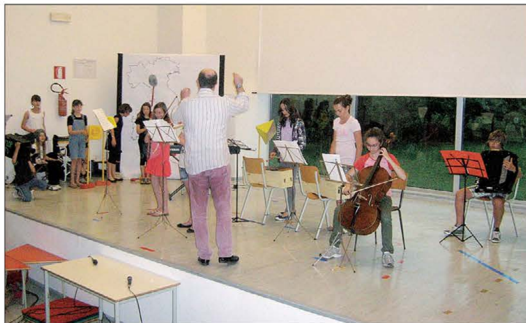
Med učenci dvojezične šole je tudi več dobrih glasbenikov