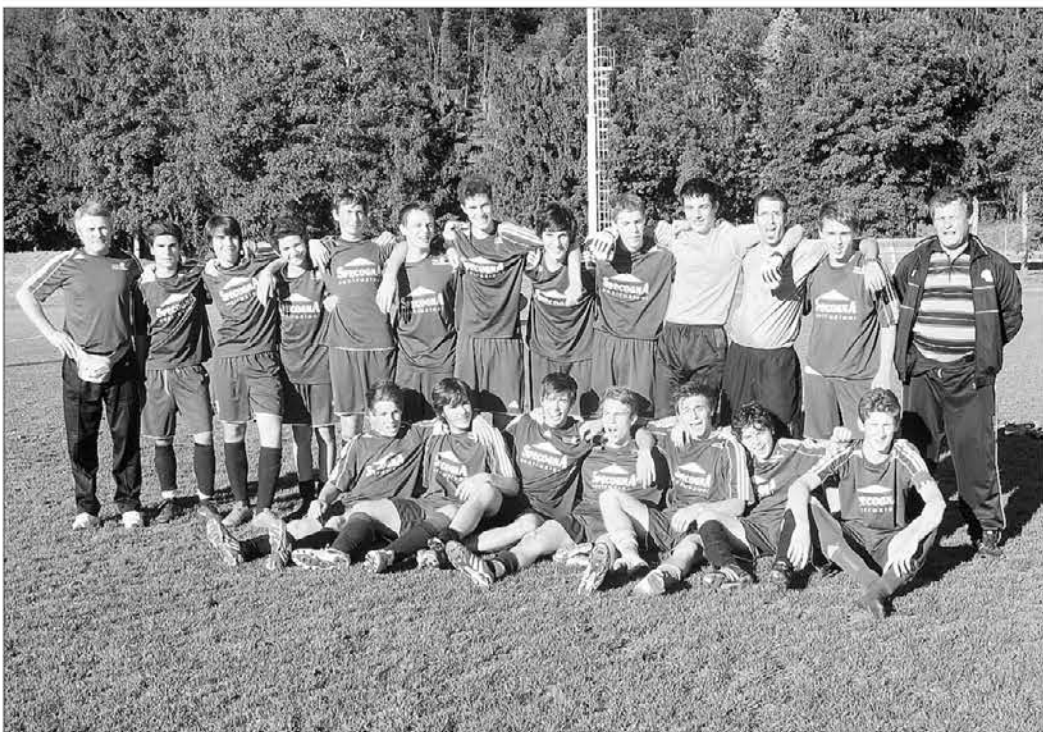
I campioni della Valnatisone con i dirigenti e l'allenatore al termine della gara con il Pagnacco

La Valnatisone chiude la stagione imbattuta