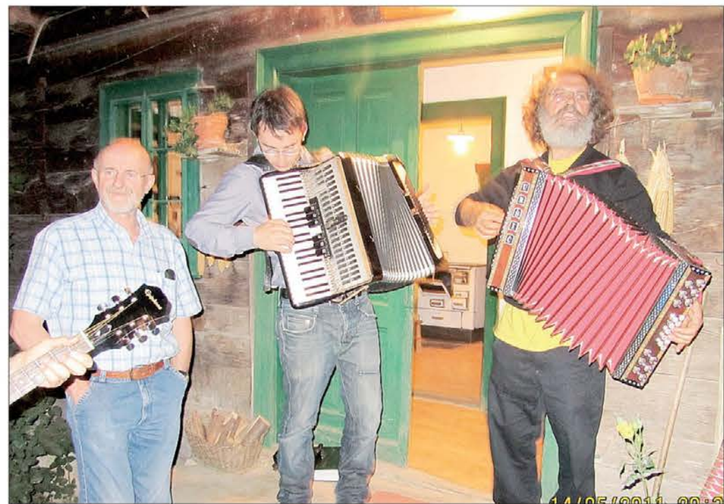
Zvičer so se odmievale naše ramonike. Pod lipo je imeu parložnost spoznat nove parjatelje an nove kraje. Tle zdo! “Gupčeva hiša”