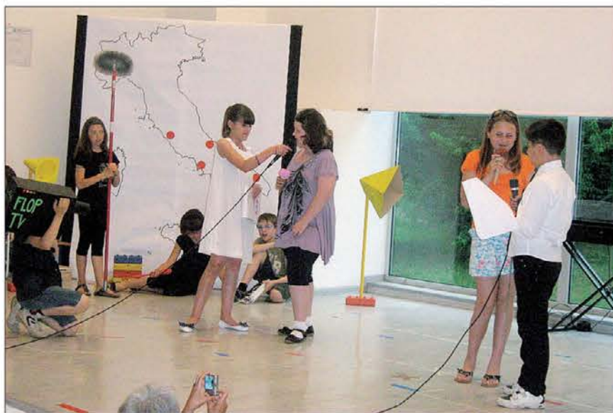
Na odru se je pojavil tudi znani slovenski pesnik France Prešeren (na levi), v Moliseju pa se je oglasila predstavnica hrvaške manjšine