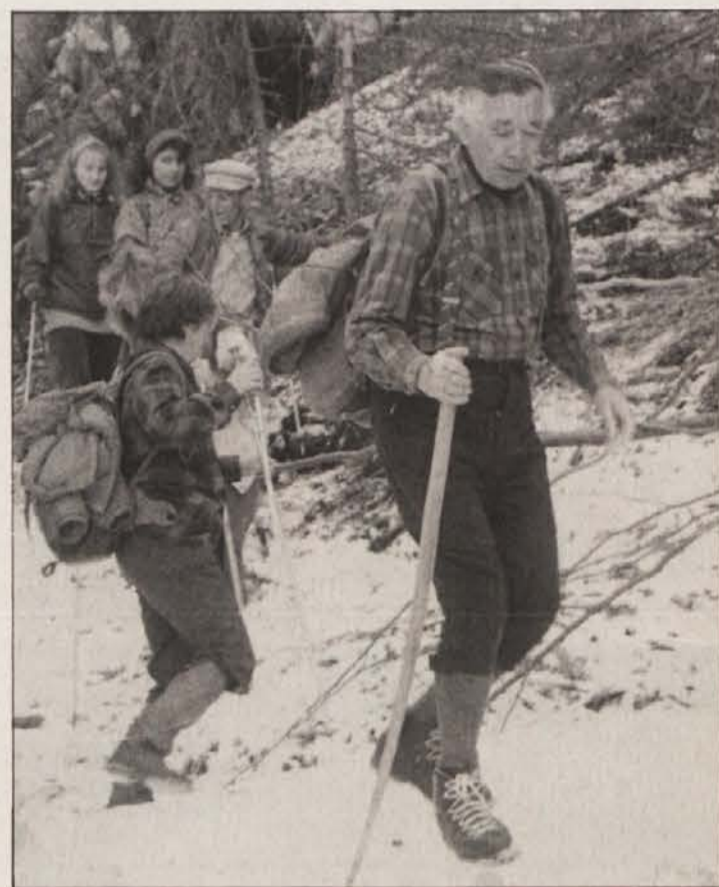
Skozi goščo in po ledu: po poteh partizanov