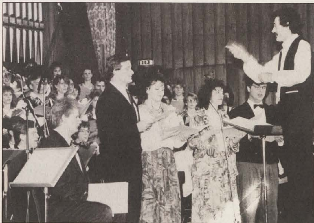
Izvedba kantate Pesem o Miklovi Zali je bila višek nedeljskega koncerta