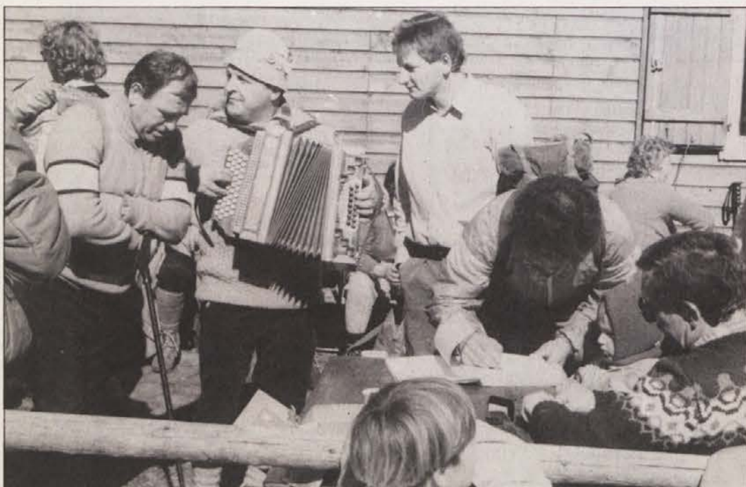
Čakanje na kontrolni žig so skrajšale viže iz harmonike