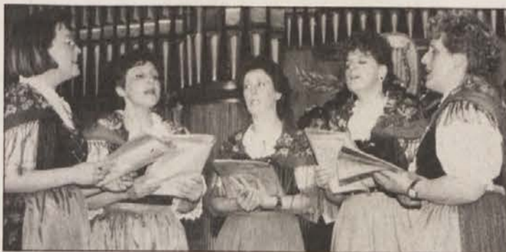
Višarski kvintet iz Ukeve