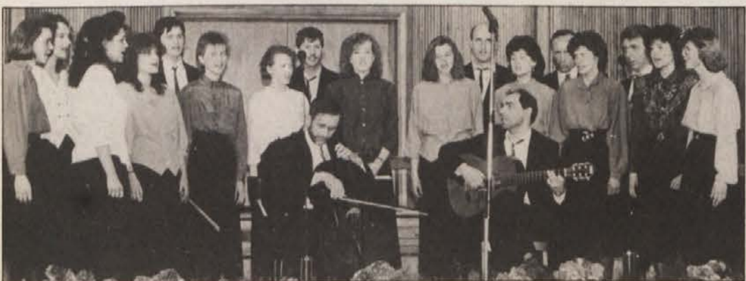
Vokalno-instrumentalna skupina „Lipa“ iz Velikovca je med svojim nastopom celo zaplesala