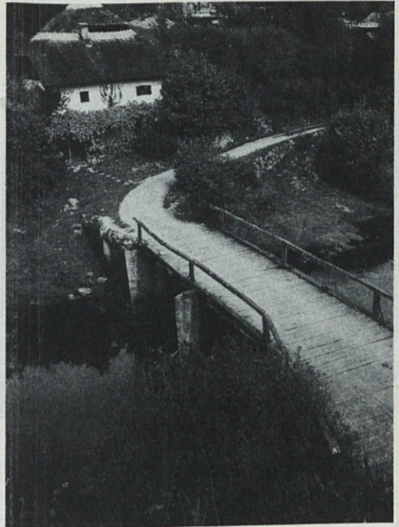
MARINČA VAS je gruščasto naselje na levem bregu Krke, ob cesti med Ivančno gorico in Žužemberkom.

„Res, to sem vam ravno hotel povedati. Prècej ko sem