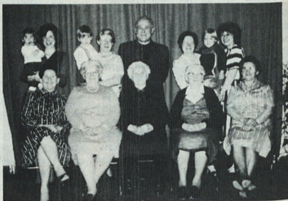
Pet rodov s svojo 95-letno praprababico

Meseca aprila sta odšla v večnost: v Lensu v svojem 78. letu g.