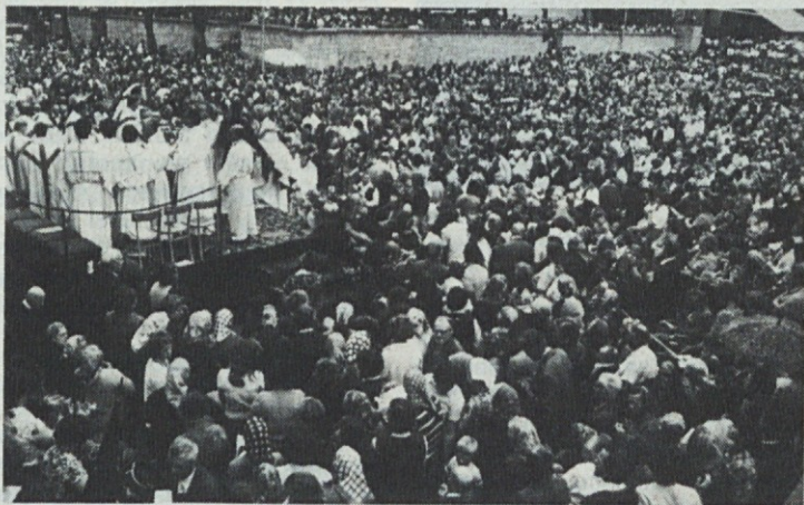
Srečanje bolnikov na Brezjah — z duhovniki in škofi.

Odgovor na gornje vprašanje najdemo v dveh stvkih svetega písma: „Bog je svet tako ljubil, da je poslal svojega edinega Sina, da bi se svet po njem zveličal“ (apostol Janez); „Hodi za meno, naredil te bom za ribiča ljudi!“ (Jezus prvemu učencu).