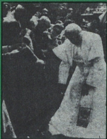
Fotografija: PAPEŽ je pri splošnem sprejemu nekemu od vernikov, ki mu je klobuk padel na tla, tega mirno pobral.

Vse, kar je v Rusiji kulturno, znanstveno in značajsko kaj vrednega, se po besedah predavateljice približuje ruski pravoslavni Cerkvi ali pa drugim krščanskim občestvom. Celotni majhni otroci pri baptistih so pripravljani na vsakršno žrtve in si upajo celo v šolo