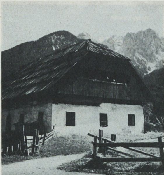
MOJSTRANA leži v gornji Savski dolini, kjer je vhod v stranske doline Vrata, Kot in Krmo, ki segajo v Triglavsko pogorje.

žite in mu povsod nagajate in stavite zanke. To se ve, da sem mu jaz te misli izbijal iz glave, a on je trmast in svojeglav, ne dá si dopovedati.“