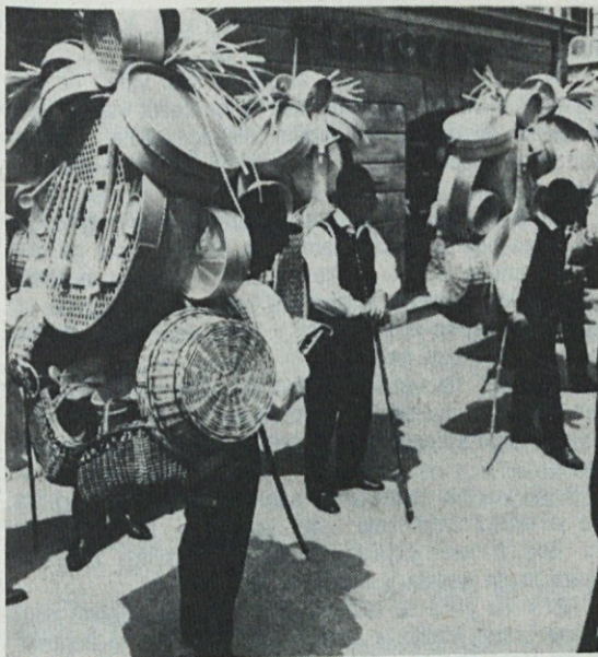
"Jest dejlam škafe in rešjeta, rajte, brjente, vsega šjenta. Jest mojstr sm od žlic, čebrú, keblú, keblíc . . ."

"Zmerom me je tožil eden," ji seže Domen v besedo, "in taisti me je tožil tudi nocoj in morda misli s menoj storiti še kaj. Po sili hoče, da bi me obesili. Pa pri moji živi duši," udari strahovito ob mizo, "jaz mu jih bom naložil, da mu ne bo treba oskrbovati nobenega posla več, ne tožiti ne opravljati. Sova me je zatožil, sovraži