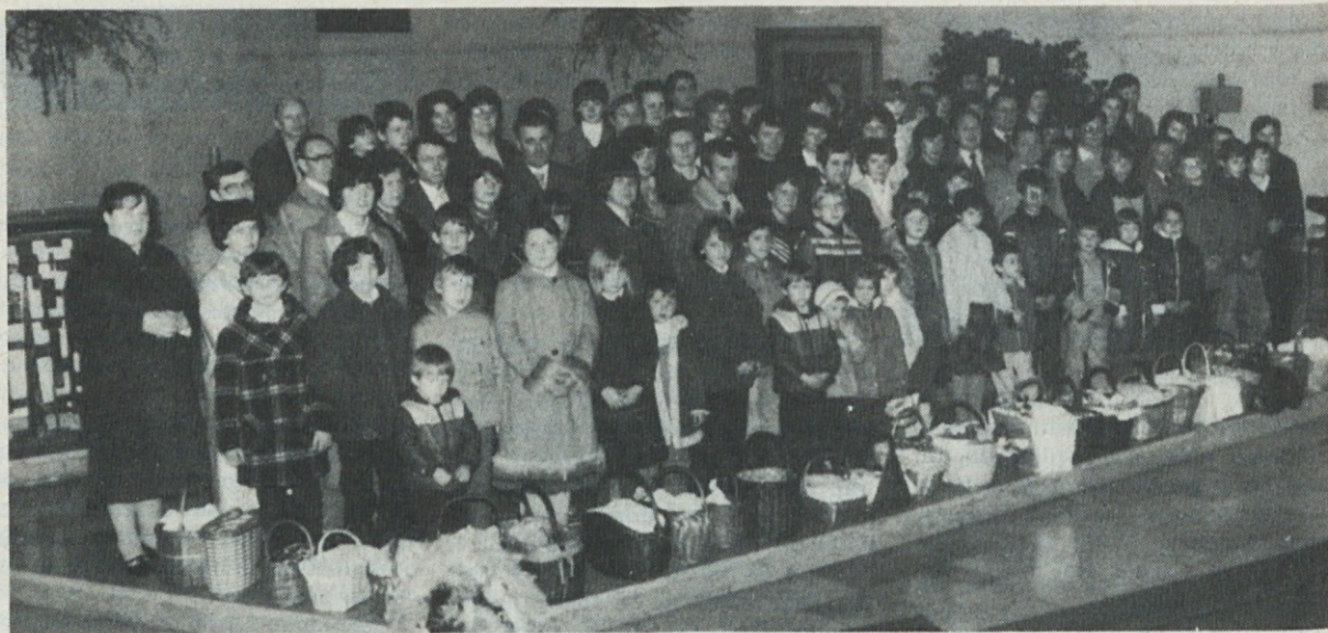
Žegen spada k slovenski veliki noči. V Esslingenu je bila pred oltarjem dolga vrsta košaric (slika), v Stuttgartu pa so bile položene v cerkvi v obliki križa.