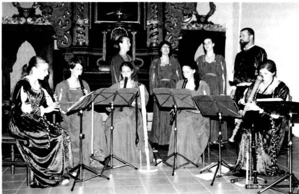
Camerata Carniola – koncert v Taboru na Češkem, 9. september 2000

celotne razstave, ki naj bi v končni obliki obsegala predstavitev petnajstih tipičnih poznosrednjeveških glasbenih instrumentov (kopije instrumentov, kopije fresk, fotografska dokumentacija drugih slovenskih upodobitev, spremni tekst, zvočna oprema in katalog razstave v obliki mape z vložnimi lističi). Za realizacijo postavitve manjka predvsem ustrezna lokacija. Ena od možnih je hodnik v pritličju Loškega muzeja, ki z okenskimi nišami ponuja ustrezno začasno rešitev. Ustrezna bi bila tudi vsebinska povezava s tam razstavljenimi eksponati, ki predstavljajo starejšo likovno produkcijo loškega prostora. Za celotno stalno postavitve pa bi zbirka nujno potrebovala ustrezen samostojni prostor, ki bi omogočil tudi zvočno prezentacijo instrumentov in srednjeveške glasbe.