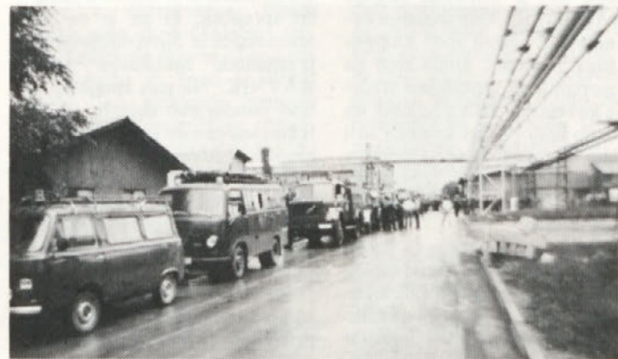
Gasilska vozila, pripravljena za predajo raporta