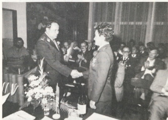
Načelnik GZS podeljuje republiška gasilska odlikovanja