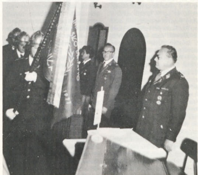
Pozdrav prihodu gasilskega prapora