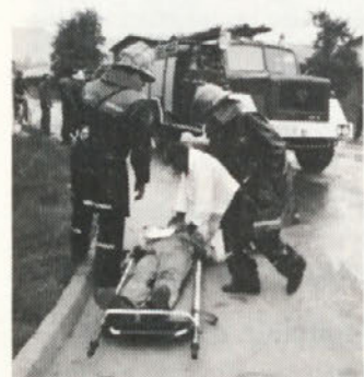
Tudi služba prve pomoči je bila ob vaji polno zasedena