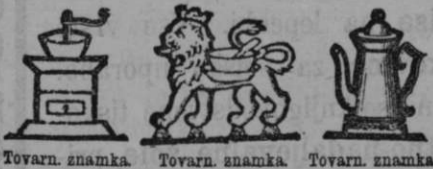
Tovarn. znamka. Tovarn. znamka. Tovarn. znamka. št. X 4457, 12:8 H. V.

da imate jamstvo za vedno jednako in najboljšo kakovost. — Pazite pri tem na varstvene znamke in podpis, kajti naše zamotanje se v enakih barvah, papirju in z podobnim natisom ponareja. —