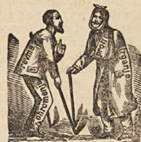
Ta iz krepkega, na lastnih goricah raščenega vina izvlečena Francovka je skušen pomoček za oživljenje dušnih in telesnih močij. Zoper protin, trganje, otrpnenje udov, revmatizem pomaga čudovito in uteši bolečine. Ena steklenica velja 1 gld. 20 kr. Stari konjak je za stare ljudi in take, ki so bolni v želedeu, prava dobrota. Cena 1 gld. 50 kr. Kdor naroči 4 steklenice, se mu dá skrinjica zastoj in plača se na pošti voznina. Dobi se samo pri Benediktu Hertl -nu, graščaku na Goliču pri Konjicah na Štajerskem.