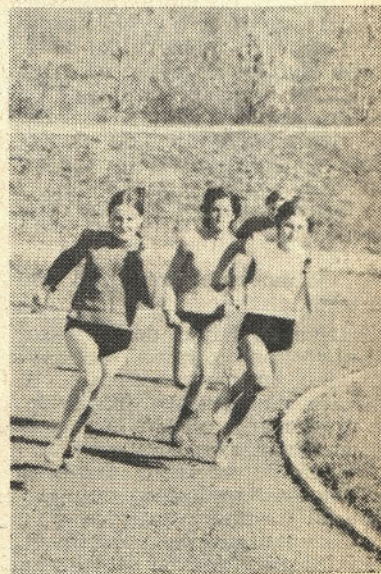
Skupina deklet pri teku na 300 m