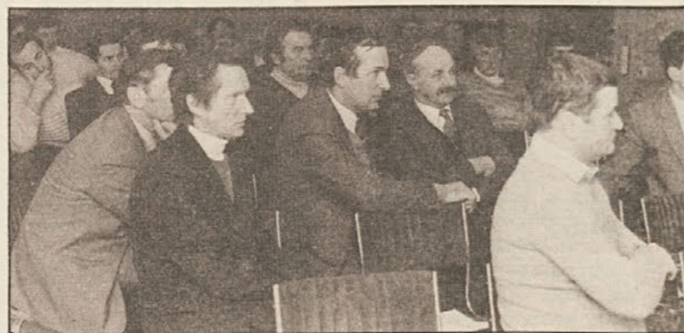
Krajevni sestanek NSKS v Pliberku

Da ob vsem administrativnem delu in ob obilici sej, sestankov in pogovorov, katerih je nekaj sto na leto, dostikrat primanjkuje časa in moči za temeljito analizo, načrtovanje in pospravo, je žal dejstvo, a naše gnotne razmere trenutno ne dovoljujejo povečanja kadra.