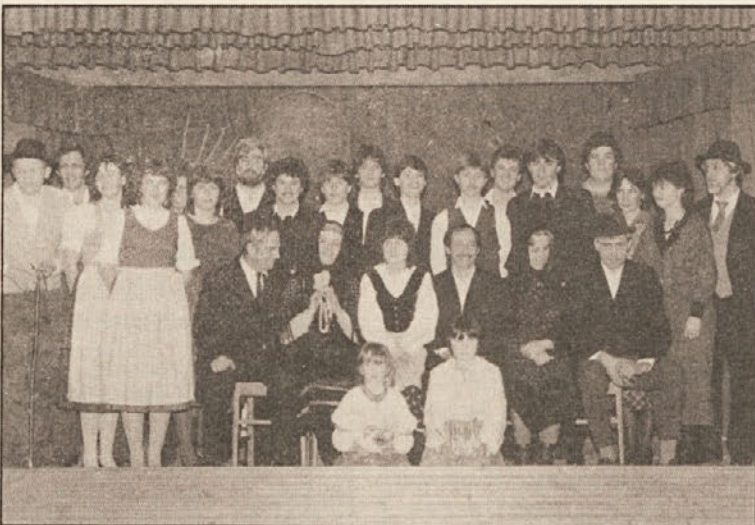
Pravposebno je bilo za občudovati, da se je na tem malem podeželskem odru moglo urejeno kretati tako veliko število sodelujočih, kar je pa možno le pri tako spretni režiji, ki so jo imeli igralci in igralke v Dobrli vasi.

Igralke in igralci so nastopili samozavestno. Vsi so bili prepričani, da bo šlo dobro, ker so jim mnoge vaje vlile igro v kri.