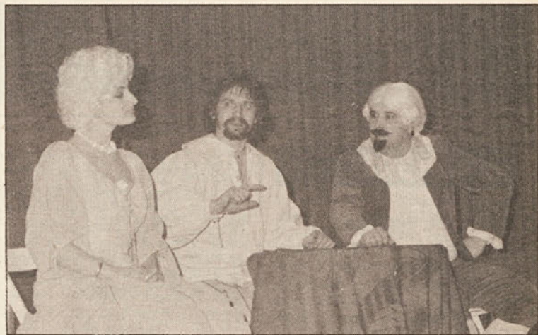
Igralska skupina SPD „Dobrač“ je zaigrala igro „Zdravnik po sili“.