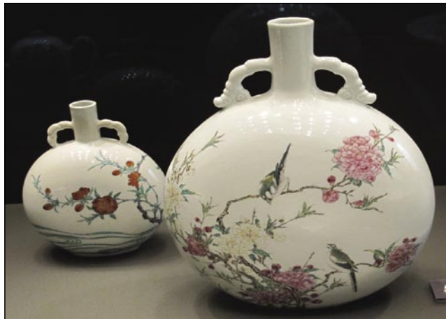
Kitajski porcelan dinastije Quing, 18. st.

Obstajata dve glavni vrsti porcelana: kaolinski in surogat-