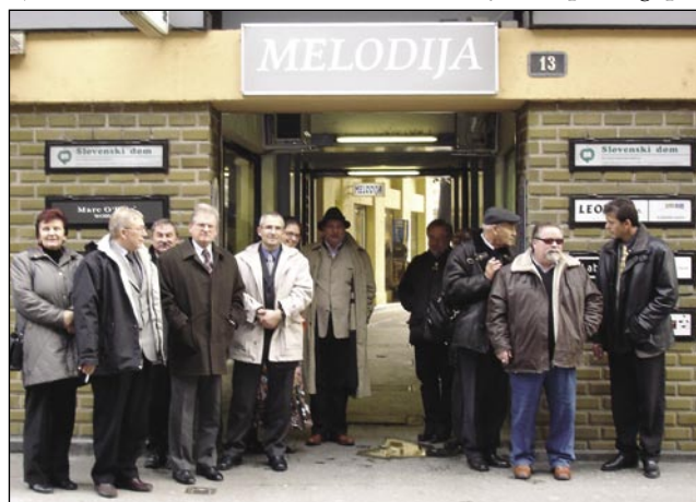
Člani krovnih organizacij Slovencev v Avstriji, Italiji, na Hrvaškem in Madžarskem, povezanih v Slovenski manjšinski koordinaciji, so imeli seje v vseh sodelujočih državah. Fotografija je nastala po sestanku leta 2005 v Zagrebu, pri Slovencih na Hrvaškem.