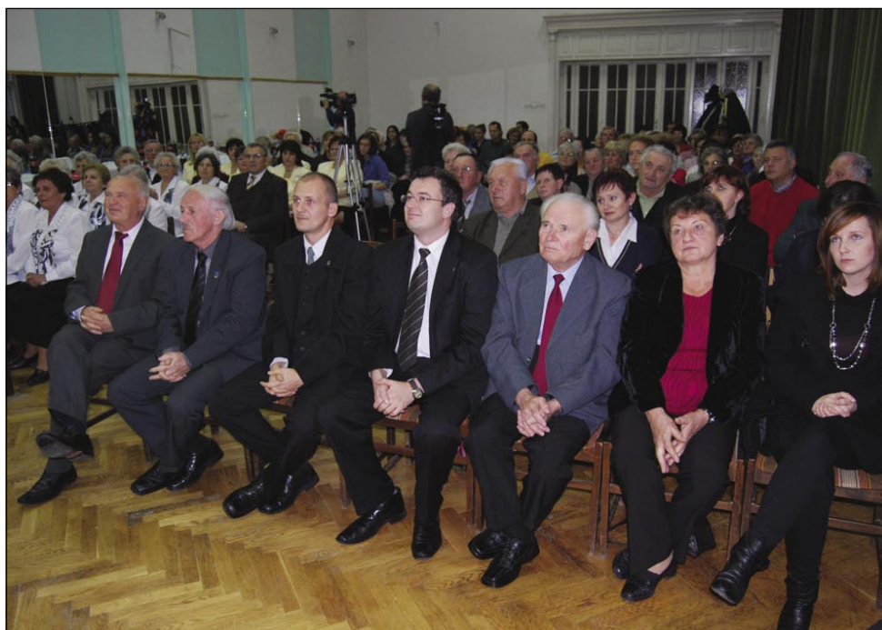
En tau publike na duplanskom svetki

Sombotelske spominčice so zaspejvale ranč tak pet pesmi z nauvoga CD-na, šteroga so gorvzeli v študioni Dragona Jošara iz Prekmurja. Te dvajsti pesmi najdemo vse v pesmaricaj »Füčkaj, füčkaj fantiček moj 1-2«, sombotelska skupina je je na CD zatok zaspejvala, ka aj bi gorostale za prišešnje generacije. Med njimi gestejo žalostne pa vesele, kračiše pa dukše, lübezenske, sodačke pa balade ranč tak.