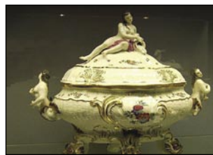
Porcelan iz Meissna

ni izdelavi tega izdelka. Niso namreč imeli pravega vzorca koalina in tudi ko so ga dobili, jim ni pomagalo do izdelave zaželenega izdelka. Manjkal