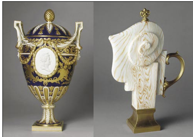
Porcelan iz Sevresa

jim je namreč recept za sestavo mešanice glinice in kaolina ter natančna višina temperature žganja.