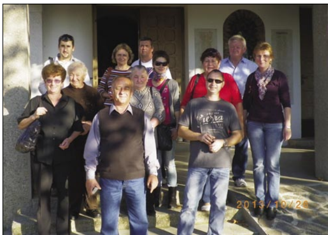
Naša skupina pri cerkvi v Turnišču

Društvo za lepšo vas in ohranjanje tradicije Števanovci