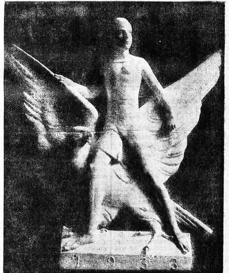
Kip Nj. Dis. Prestolonaslednika Petra, starešine našega Sokolstva, koji je postavljen u novom domu Sokolskog društva Zagreb I; rad prof. Franje Kršinića