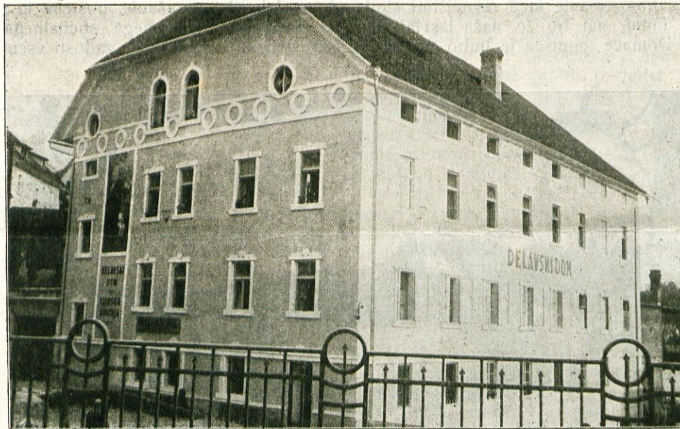
Delavski dom v Kranju.